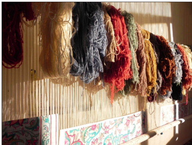
تصویر ۵. رنگ‌های مورد استفاده بافنده ساروقی (نگارنده، ۱۳۹۷)

صورتی و... همراه با طیف‌های رنگی گسترده می‌باشد (تصویر ۵).