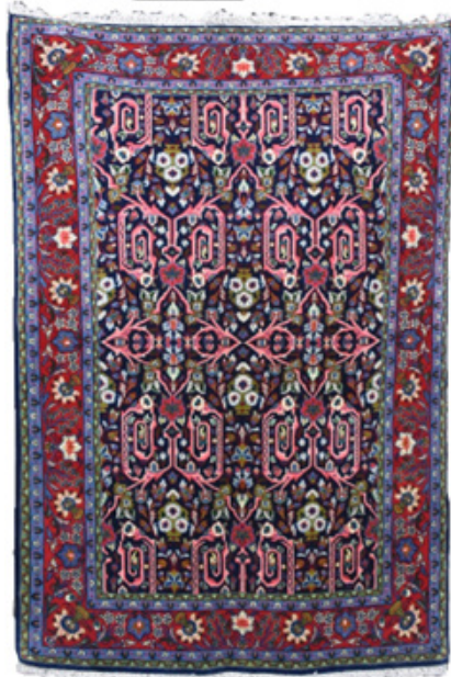
تصویر ۷. قالیچه با طرح مستوفی موجود در اتحادیه مرکزی اتحادیه‌های استانی فرش دست‌باف روستایی ایران، بافت جدید، ابعاد: ۱۰۷+۱۶۰