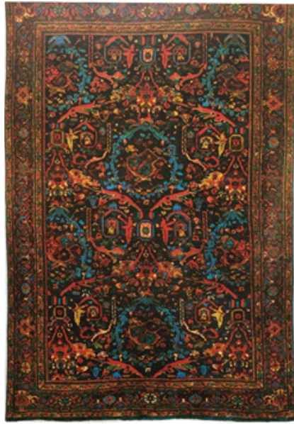
تصویر ۶. قالیچه ساروق با طرح مستوفی، متعلق به ۱۹۳۰، ابعاد: ۱۱/۲+۳۸/۱ (اشنبرنر، ۱۳۷۴: ۸۱)