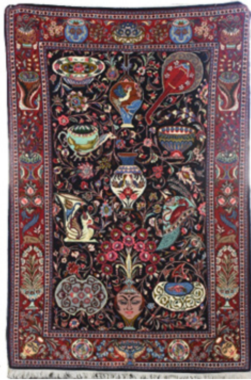
تصویر ۱۰. قالیچه با طرح زیرخاکی، ابعاد: ۲/۰۵+۱/۳۰، (نگارنده، ۱۳۹۷)