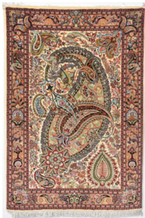
تصویر ۹. قالیچه با طرح تک بته، ابعاد: ذرع و نیم (نگارنده، ۱۳۹۷)