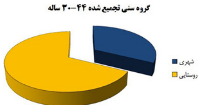
تصویر ۳. رده سنی ۳۰-۴۴ به تفکیک شهری و روستایی (سند راهبردی فرش دست باف استان مرکزی، ۱۳۹۴: ۱۵۱)

در ساروق تمایل بیشتر برای قالی بافی به صورت غیر متمرکز است و با وجود راه اندازی کارگاه های متعدد تا به امروز بیشتر بافندگان به صورت تک بافی کار می کنند و به دلیل نبود استقبال قالی بافان تمام کارگاه ها به مرور زمان جمع شده اند. می توان گفت قالی بافی در ساروق بیشتر جنبه ی تفننی پیدا کرده است. متأسفانه آمار دقیقی از تعداد بافندگان فعال در این منطقه در دست نیست. از میان تشکل های فعال در استان مرکزی که به طور مستقیم و غیر مستقیم در تولید فرش نقش دارند (شرکت سهامی فرش، شرکت های تعاونی فرش دست باف، بنیاد تعاون زندانیان و کمیته ی امداد امام خمینی ره) نیز تنها مرکز نیکوکاری به عنوان یکی از زیرشاخه های کمیته ی امداد در ساروق دارای شعبه می باشد که از ۱۳۹۰ فعالیت خود را در این شهر آغاز کرده و بعد از گذشت چند سال توانسته ۵۰۰ خانواده را تحت پوشش خود قرار دهد، که از این تعداد حدود ۲۰۰ خانوار آنها دارای مشاغل قالی بافی هستند (سلیمی پناه: ۱۰/۱۳۹۷). قابل ذکر می باشد که حمایت