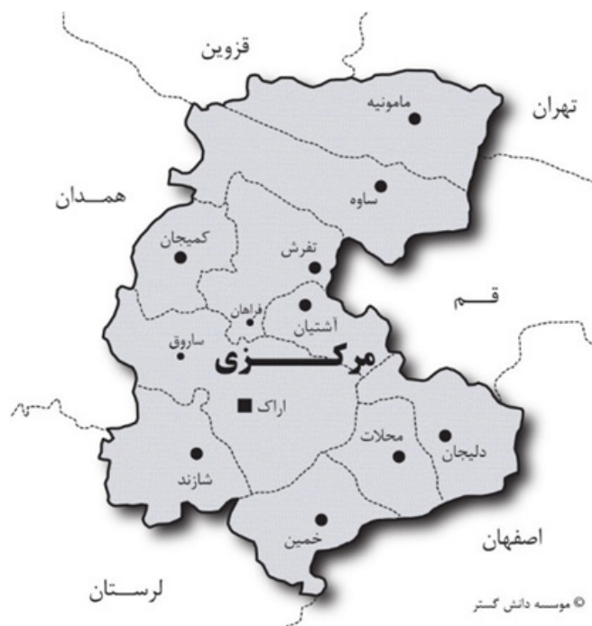
تصویر ۱. نقشه استان مرکزی (wikijoo.ir، ۱۳۹۷)

۱۲۶۲ش/ ۱۸۸۳م در زمینه‌ی سفارش، تولید و صدور آغاز کرد (شاعری، ۱۳۷۱: ۳۰۸). به دنبال این شرکت، کمپانی‌های دیگری نیز در اراک فعالیت خود را آغاز کردند. هر چند دوران مدیریت این شرکت‌ها با بروز بحران بزرگ اقتصادی در ۱۹۲۹ به اتمام رسید (نصیری، ۱۳۸۹: ۱۶۹). و به دنبال آن مدیریت قالی به صورت دولتی، در ۱۳۰۹ش با تأسیس موسسه‌ی قالی ایران آغاز شد (حشمتی رضوی، ۱۳۸۱: ۷۲). شرکت بعدی با نام شرکت سهامی فرش ایران نیز در سال ۱۳۱۴ آغاز به کار کرد، این شرکت یک سال بعد شعبه‌ای در سلطان‌آباد نیز دایر کرد، و در سال ۱۳۱۹ نیز اقدام به راه‌اندازی کارگاه‌های بافت قالی در روستای ساروق و چند روستای دیگر از جمله غیاث‌آباد، بهادرستان، فارس‌سیجان، و دیگر مناطق کرد (شاعری، ۱۳۷۱: ۳۴۶). از دیگر ارگان‌هایی که در سال‌های اخیر اقدام به تولید قالی در ساروق و دیگر مناطق استان کرده‌اند می‌توان به بهزیستی و کمیته‌ی امداد امام خمینی اشاره کرد. در بین سازمان‌ها و مراکز دولتی نام برده، فعالیت وزارت جهاد سازندگی، کمیته‌ی امداد امام خمینی و سازمان بهزیستی به خاطر اهداف اجتماعی و اقتصادی و ایجاد اشتغال در شرایط اضطراری بوده است، اما سازمان صنایع دستی و شرکت سهامی فرش ایران با در نظر گرفتن اهداف آنها که به طور مستقیم فرش در ارتباط است، دارای اهمیت بیشتری هستند (صوراسرافیل، ۱۳۷۲: ۸۶).