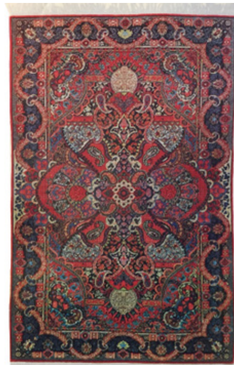
تصویر ۱۱. قالیچه ساروق با طرح جغرافیا، ابعاد: ۲/۰۵+۱/۲۵، (دانشگر، ۱۳۷۲: ۷۳)