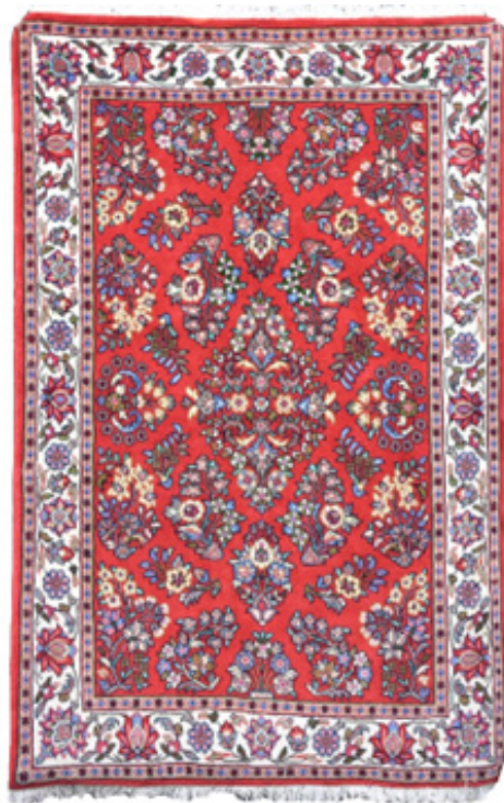
تصویر ۸. قالیچه با طرح دسته‌گلی، ابعاد: ۱/۶۰+۱/۰۷