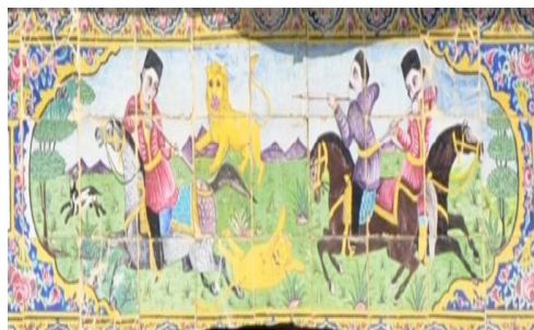
تصویر ۱۲. شکار شیر، سنتوری بالای تالار مرکزی، خانه زینت‌الملک، شیراز