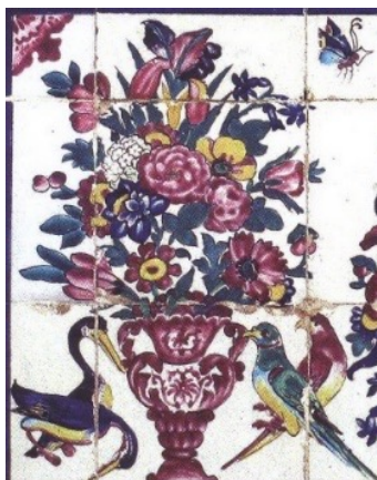
تصویر ۱۰. گل و گلدان، ضلع جنوبی، خانه محتشم، شیراز (ماخذ: ریاضی، ۱۳۹۵: ۳۰۰)