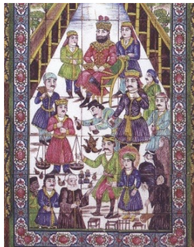
تصویر ۹: فروش یوسف در بازار مصر، حیاط، خانه عطروش، شیراز

در ادامه نمونه‌هایی از تاثیرات بازار در دوره قاجار بر نقوش کاشی‌کاری خانه‌های قاجاری شیراز بررسی می‌شود.