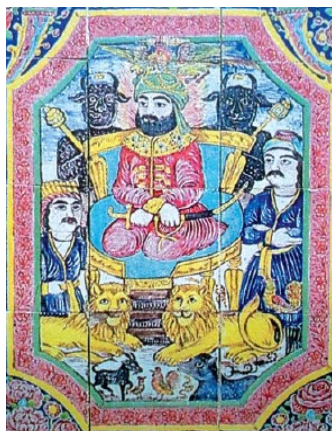
تصویر ۶. بارگاه سلیمان نبی، حوضخانه، خانه حیاط، خانه عطروش، شیراز

در تصویر ۴، مریم مقدس و حضرت مسیح با هاله‌ای دور سر دیده می‌شوند. در بالای سر آنها دو فرشته عریان به صورت قرینه در حال پرواز هستند. این کاشی‌کاری بخشیدن حضرت عیسی به مریم مقدس از طرف خداوند را به تصویر می‌کشد که در چندین سوره قرآن از جمله سوره "مریم" آیات ۱۷ تا ۲۱، سوره "آل عمران" آیات ۴۵ و ۴۷، سوره "انبیا" آیه ۹۱ و سوره "تحریم" آیه ۱۲ به آن اشاره شده است. در تصویر ۵، برادران یوسف در حال افکندن او به چاه هستند. یوسف با هاله دور سر در میانه تصویر نشان داده شده، پیراهن به تن ندارد، دستانش با طناب بسته شده و معصومانه به برادرانش می‌نگرد. پایین تصویر، پیراهن سفید رنگ، دریده شده و آغشته به خون یوسف در دست برادران دیگر است. در قسمت بالا یعقوب نبی با هاله دور سر منتظر بازگشت پسرانش است. این تصاویر به تاثیر از آیات ۹، ۱۰، ۱۷ و ۱۸ سوره "یوسف" هستند.