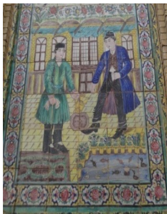
تصویر ۲. صاحب خانه و خدمتکار، حیاط، خانه عطروش، شیراز