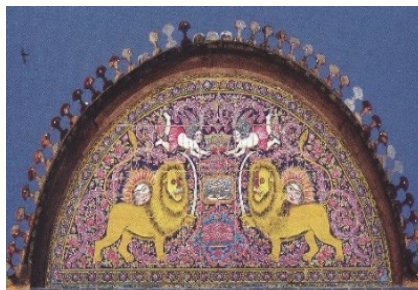
تصویر ۱۶. شیر و خورشید، سنتوری بالای تالار مرکزی، خانه زینت الملک، شیراز

در تصویر ۱۴، دو الهه بالدار در حال پرواز به صورت قرینه، تاج کیانی را به دست گرفته‌اند. الهه‌ها نیمه پوشیده هستند و دامن کوتاهی به تن دارند. در تصویر ۱۵ نیز دو الهه بالدار در حال پرواز به صورت قرینه، تاج کیانی را به دست گرفته‌اند. الهه‌ها نیمه‌پوشیده هستند و دامن کوتاهی به تن دارند. نقش الهه بالدار (الهه نیکه) از دوره سلوکیان و اشکانیان بر روی سکه‌ها ظاهر می‌شد و در دوره ساسانی نیز در سایر هنرهای تزئینی دیده می‌شود. در دوره اسلامی این نقش در آثار هنری دیده می‌شود. در هنر قاجار الهه‌های بالدار به صورت هیاکل کوتاه و چاق و ابروان بهم پیوسته به سبک قاجاری به نمایش در آمده‌اند و پوشش آنها با رنگ‌های تند از هنر باروک تاثیر پذیرفته است (افشار، ۱۳۸۶: ۱۱۸). با توجه به آنچه گفته شد نقش الهه بالدار در هنر قاجار با پوشش متأثر از هنر فرنگی بازتابی از تلفیق هنر سنتی و فرنگی آن دوران است.