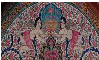
تصویر ۱۴. الهه بالدار، سنتوری مرکزی، خانه زینت‌الملک، شیراز

در تصویر ۱۲، چند اسب سوار همراه با سگ تازی در حال شکار شیر دیده می‌شوند. دو سوار به عقب برگشته و گلوله‌ای به یکی از شیرها شلیک کرده‌اند. در تصویر ۱۳، سه اسب سوار در حال شکار آهو هستند. دو سوار به عقب برگشته و شلیک می‌کنند و سوار دیگر پرنده‌ای شکاری بر دست دارد. در تصاویر فوق پوشش شکارچیان کاملاً ایرانی است، لباس آنها از کمر چین دارد و روی برخی از آنها بته جقه دیده می‌شود. صحنه شکار و سواران از نقوش مورد علاقه ایرانیان از دوره‌های پیش از تاریخ است (افشار، ۱۳۸۶: ۱۰۹). استفاده از الگوی شکار ساسانی (برگشتن رو به عقب و تیراندازی و گاه وجود پرنده شکاری بر روی دست شکارچی) در نقوش شکار در دوره قاجار تحت تاثیر سنت‌گرایی است و استفاده از تفنگ و سگ تازی تحت تاثیر الگوی شکار اروپاییان است. با این تفاوت که در اروپا سگ را به دنبال خرگوش می‌اندازند و در ایران سگ را به دنبال شکار بزرگ می‌اندازند (دروویل، ۱۳۸۸: ۱۴۸). به عبارتی کاشی‌کاری‌های فوق تحت تاثیر هم‌زمان سنت‌گرایی و الگوی شکار اروپایی هستند.