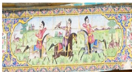
تصویر ۱۳. شکار آهو، سنتوری بالای تالار مرکزی، خانه زینت‌الملک، شیراز

در تصویر ۱۲، چند اسب سوار همراه با سگ تازی در حال شکار شیر دیده می‌شوند. دو سوار به عقب برگشته و گلوله‌ای به یکی از شیرها شلیک کرده‌اند. در تصویر ۱۳، سه اسب سوار در حال شکار آهو هستند. دو سوار به عقب برگشته و شلیک می‌کنند و سوار دیگر پرنده‌ای شکاری بر دست دارد. در تصاویر فوق پوشش شکارچیان کاملاً ایرانی است، لباس آنها از کمر چین دارد و روی برخی از آنها بته جقه دیده می‌شود. صحنه شکار و سواران از نقوش مورد علاقه ایرانیان از دوره‌های پیش از تاریخ است (افشار، ۱۳۸۶: ۱۰۹). استفاده از الگوی شکار ساسانی (برگشتن رو به عقب و تیراندازی و گاه وجود پرنده شکاری بر روی دست شکارچی) در نقوش شکار در دوره قاجار تحت تاثیر سنت‌گرایی است و استفاده از تفنگ و سگ تازی تحت تاثیر الگوی شکار اروپاییان است. با این تفاوت که در اروپا سگ را به دنبال خرگوش می‌اندازند و در ایران سگ را به دنبال شکار بزرگ می‌اندازند (دروویل، ۱۳۸۸: ۱۴۸). به عبارتی کاشی‌کاری‌های فوق تحت تاثیر هم‌زمان سنت‌گرایی و الگوی شکار اروپایی هستند.