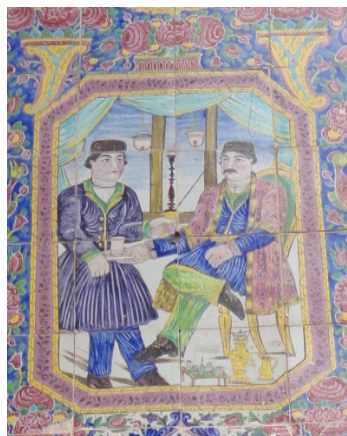
تصویر ۳: گفت‌وگو در قهوه خانه، حیاط، خانه عطروش، شیراز

در تصویر ۲، دو نفر در مقابل هم ایستاده‌اند. فرد سمت چپ آفتابه و حوله‌ای در دست دارد و در حال ریختن آب بر دست فرد سمت راست است. احتمالاً یکی از این افراد صاحب‌خانه (ارباب) و دیگری خدمتکار اوست. نظام ارباب رعیتی حاکم بر جامعه قاجاری به صورت سلسله مراتبی در روابط میان شاه و زیردستانش، حکام ولایت و رعایای آنها و در نهایت در روابط میان افراد متمول مانند صاحبان خانه‌ها و خدمتکاران آنها در دوره قاجار دیده می‌شد. همان‌طور که زیردستان در خدمت شاه بودند، خدمتکاران نیز در خدمت اربابان خود بودند. در این کاشی‌کاری برتری اجتماعی ارباب بر خدمتکارش از طریق پوشش متفاوت، قد بلندتر ارباب و محل قرارگیری آنها نسبت به یکدیگر به نمایش در آمده است. بدین ترتیب کاشی‌کاری فوق به تاثیر از ساختار جامعه قاجار است.