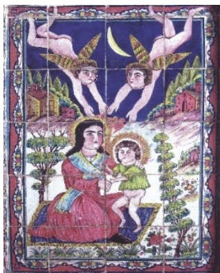
تصویر ۴. مریم مقدس و مسیح، عطروش، شیراز

قابل مشاهده است. این کاشی کاری با در بر داشتن یک مکان مهم شهری (قهوه‌خانه) و نوعی از ارتباط (گفت‌وگو) میان اقشار مختلف اجتماع، تحت تاثیر ساختار جامعه دوره قاجار شکل گرفته است. ۲-۳ اعتقادات مذهبی در دوره قاجار و تاثیر آن بر شکل‌گیری نقوش کاشی کاری‌های خانه‌های قاجاری شیراز: در مدت استقرار قاجار در ایران تا انقلاب مشروطیت، علما نقش مهمی بر عهده داشتند. تمایل افراد به شیعه‌گری در این دوره شدت یافت (الگار، ۱۳۵۶: ۸۰). در دوره قاجار، تاریخ تشیع شاهد شکل‌گیری قدرت سیاسی اجتماعی عالمان طراز اول تشیع بود. همین امر نقاشی مذهبی را در بین توده مردم محبوب تر ساخت. در این دوره علما سخت‌گیری‌های ترسیم شمایل‌نگاری را کنار گذاشتند (دانش صدیق، ۱۳۹۷: ۲۴۰). امنیت نسبی در اوایل قاجار، محیط لازم را برای فعالیت علما فراهم کرد (الگار، ۱۳۵۶: ۸۰). در دوره فتحعلی شاه می‌توان شاهد گسترش دربار بود. مذهبی بودن حکومت فتحعلی شاه مشخص بود. ساخت مساجد و تزئین حرم‌ها دلیلی بر اثبات این ادعا است. دربار در پی جلب محبت علما می‌کوشید تا آنها را به مقرر حکومت خود جلب کند (الگار، ۱۳۵۶: ۱۰۶-۱۰۵). در دوره ناصرالدین شاه بار دیگر اقداماتی برای پدید آمدن روابط میان علما و دولت صورت گرفت، اما نتیجه‌ای حاصل نشد. زیرا نفرت آشکار از سلسله قاجار از طرف مردم مزید بر علت شده بود. در ایام صدارت میرزا آقاخان نوری کشمکش میان علما و دولت کاستی گرفت (مونس‌ی سرخه، ۱۳۹۶: ۱۸۹). در ادامه نمونه‌هایی از تاثیرات اعتقادات مذهبی بر شکل‌گیری کاشی کاری‌هایی با موضوعات مذهبی در خانه‌های قاجاری شیراز بررسی می‌شود.