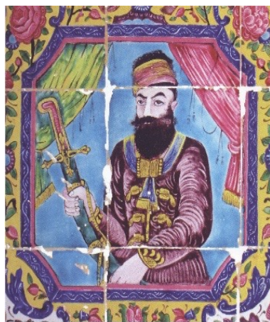
تصویر ۸. کریم‌خان زند، نمای بنا، خانه دخانچی، شیراز (ماخذ: ریاضی، ۱۳۹۵: ۲۹۱)

در تصویر ۷، زنی با چهره قاجاری، کلاهی مرصع و لباس فرنگی به تن دارد. این کاشی کاری تحت تاثیر رخدادهای فرهنگی (تحول در پوشاک) در دوره قاجار است. در تصویر ۸، کریم‌خان زند کلاهی بر سر، شمشیری جواهر نشان در دست و لباسی با بیراق طلائی به تن دارد. در دوره قاجار، تصاویر شاهان و زنان با چهره‌های قاجاری و کلاه و لباس فرنگی، با شاخه گلی در دست و یا پرندگی ای مانند طوطی بر شانه به وفور