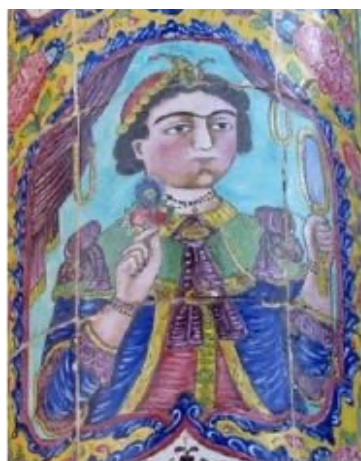
تصویر ۷. پرتزه زن قاجاری با لباس فرنگی، نمای بنا، خانه صالحی، شیراز

شیراز: از جمله رخدادهای فرهنگی در دوره قاجار می‌توان به تحول در پوشاک و عکاسی اشاره کرد. در این دوره پارچه و لباس و طراحان مد و دوزندگان اروپایی به ایران وارد شدند. این موارد باعث تحول و تنوع در سبک پوشاک به ویژه نخبگان و تحصیل کردگان شهر نشین شد و رفته رفته در همه اقشار و گروه‌های شهری راه یافت و الگوی پوششی سنتی قدیم مردم را دگرگون کرد (پار شاطر، ۱۳۸۲: ۲۵). همچنین فن عکاسی در اواخر پادشاهی محمدشاه در ایران رواج یافت و نخستین عکس‌ها از محمدشاه و درباریان در کاخ گلستان گرفته شد. در دوره ناصری نیز عکس‌هایی از دانش آموزان دارالفنون، درباریان و رجال گرفته شد (ریاضی، ۱۳۹۵: ۸۸). در ادامه نمونه‌هایی از تاثیرات رخدادهای فرهنگی دوره قاجار بر نقوش کاشی کاری خانه‌های قاجاری شیراز بررسی می‌شود.