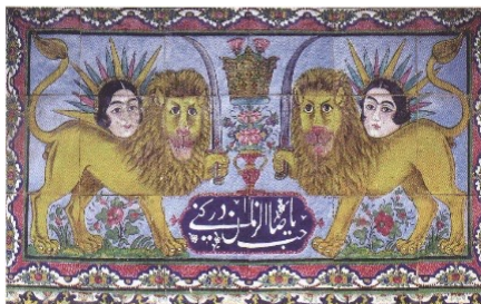
تصویر ۱۷. شیر و خورشید، نمای بیرونی، خانه دخانچی، شیراز

در تصویر ۱۶، دو شیر یال‌دار مقابل به هم در دو طرف یک گلدان ایستاده‌اند. شیرها شمشیر به دست دارند و خورشیدی بر پشت آنها دیده می‌شوند. همچنین عبارت "نصر من الله و فتح قریب" در این کاشی‌کاری دیده می‌شود. در تصویر ۱۷، دو شیر یال‌دار مقابل به هم در دو طرف یک گلدان ایستاده‌اند. شیرها شمشیر به دست دارند و خورشیدی بر پشت آنها دیده می‌شوند. همچنین عبارت "یا صاحب الزمان ادرکنی" در