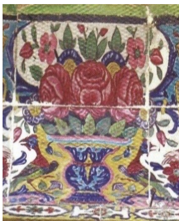
تصویر ۱۱. گل و گلدان، زیر رخ بام، خانه صالحی، شیراز

در تصویر ۱۰، یک گلدان دسته‌دار و پایه‌دار پر از برگ و گل زنبق، گل سرخ و گل چند پر در وسط تصویر قرار دارد. در طرفین آن چند پرند (مرغابی و طوطی) نشسته‌اند و پروانه‌ای در حال پرواز بر بالای گلدان دیده می‌شود. در تصویر ۱۱، یک گلدان پایه‌دار پر از برگ و گل‌های سرخ و چند پر در وسط قرار دارد و دو طاووس در طرفین آن به حالت قرینه نشسته‌اند و سر خود را به عقب برگردانده‌اند. نقش گل و گلدان از تزیینات موجود در هنر و معماری ایران است. تفاوت نقش گلدانی در دوره قاجار با دوره‌های قبل در این است که از ظرافت و جزییات بیشتری برخوردار است، اثری از نقوش سنتی نیست و جای آن با گل و برگ فرنگی گرفته شده است (صراف زادگان، ۱۳۸۰: ۱۰۶). در دوره قاجار با توجه به سبک باروک و پس از آن روکوکو در اروپا، در استفاده از نقوش تزیینی و پرکار بودن این نقوش افراط می‌شود و رنگ‌های غالب نیز بیشتر رنگ‌های گرم و درخشانی است که در دربارهایی همچون دربارهای فرانسه و اسپانیا به چشم می‌خورد (زابلی‌نژاد، ۱۳۸۷: ۱۶۰). به عبارتی نقش گل و گلدان در دوره قاجار تلفیقی از سنت گرایی و تاثیر هم‌زمان از سبک‌های غربی است. در واقع، هنرمندان قاجاری اگر چه از نقوش فرنگی استفاده می‌کردند، لیکن نحوه ترکیب‌بندی و روسازی این نقوش به شیوه ایرانی انجام می‌شده است.