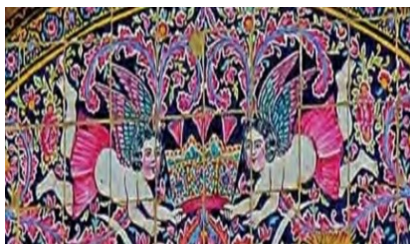
تصویر ۱۵. الهه بالدار، سنتوری مرکزی، خانه قوام، شیراز

در تصویر ۱۴، دو الهه بالدار در حال پرواز به صورت قرینه، تاج کیانی را به دست گرفته‌اند. الهه‌ها نیمه پوشیده هستند و دامن کوتاهی به تن دارند. در تصویر ۱۵ نیز دو الهه بالدار در حال پرواز به صورت قرینه، تاج کیانی را به دست گرفته‌اند. الهه‌ها نیمه‌پوشیده هستند و دامن کوتاهی به تن دارند. نقش الهه بالدار (الهه نیکه) از دوره سلوکیان و اشکانیان بر روی سکه‌ها ظاهر می‌شد و در دوره ساسانی نیز در سایر هنرهای تزئینی دیده می‌شود. در دوره اسلامی این نقش در آثار هنری دیده می‌شود. در هنر قاجار الهه‌های بالدار به صورت هیاکل کوتاه و چاق و ابروان بهم پیوسته به سبک قاجاری به نمایش در آمده‌اند و پوشش آنها با رنگ‌های تند از هنر باروک تاثیر پذیرفته است (افشار، ۱۳۸۶: ۱۱۸). با توجه به آنچه گفته شد نقش الهه بالدار در هنر قاجار با پوشش متأثر از هنر فرنگی بازتابی از تلفیق هنر سنتی و فرنگی آن دوران است.