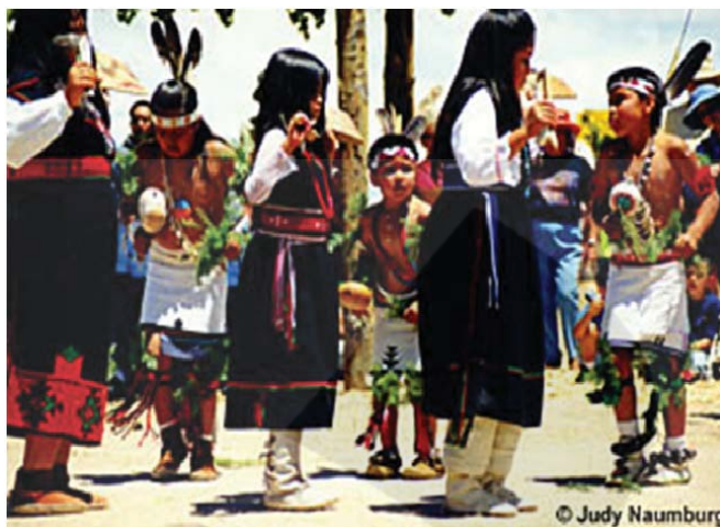
شکل ۳. مراسم آیینی پوئبلوها

همچون فرهنگستان هنر، سازمان میراث فرهنگی، صنایع دستی و گردشگری و دیگر سازمان‌ها و ارگان‌های مرتبط بوده است. همچنین شمار زیادی فیلم و آثار سمعی-بصری مستندگونه از هنر و فرهنگ عشایر و اقوام ایران تهیه شده است.[۹]