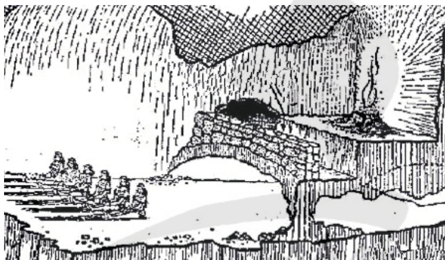
شکل ۱. ترسیمی از غار افلاطون

همان‌طور که دیده می‌شود، اگر وجوه ارزش‌گذارانه را از کار افلاطون حذف کنیم، منطقی که او عرضه می‌کند منطقی رده‌گذارانه است که عیناً در انواع روش‌های دسته‌بندی و سلسله‌گماری در علوم مختلف نیز دیده می‌شود. کارل فون لینه گیاه‌شناس سوئدی (۱۷۰۷-۷۸)، علم رده‌بندی و طبقه‌گذاری گیاهان و موجودات زنده را بر اساس خصصت‌های ریخت‌شناختی ساده بنیاد نهاد. لینه برای مثال، پرندگان را بر مبنای شکل منقار و گیاهان را بر پایه جزئیات شکل اندام‌های آنها به انواع و دسته‌های مختلف تقسیم کرد (Loonen, 2008, 145-6). در شیمی جدول تناوبی عناصر را داریم که عناصر و به تبع آنها ترکیبات‌شان را بر حسب عدد اتمی رده‌گذاری می‌کند. این جدول عناصر را چنان مرتب می‌کند که عناصر با خواص مشابه در زیر یکدیگر در ستون‌های قائم قرار می‌گیرند (مصاحب، ۱۳۸۱، ۲۰۰۳- ذیل مدخل «قانون تناوب»).