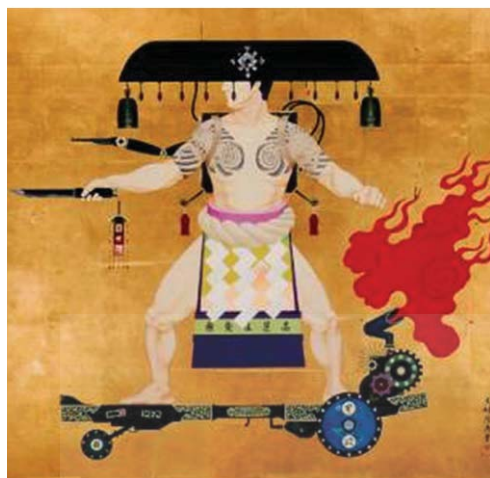
شکل ۶. هسیاشی تنمیویا، بدون عنوان، منبع: nezumi. dumousseau.free.fr

یکی از قوی‌ترین و ژرف‌ترین نقدها را بر جامعه جهانی شده و فضای پسامدرن، فردریک جیمسون (زاده ۱۹۳۴)، منتقد ادبی و نظریه‌پرداز آمریکایی مارکسیسم سیاسی در مقاله مشهور «منطق فرهنگی سرمایه‌داری متأخر» مطرح کرده است. نخستین ایرادی که جیمسون بر میدان اجتماعی-فرهنگی پسامدرن وارد می‌کند که خود از تبعات و در عین حال از مسببان جهانی شدن است، تنزل محتوایی و مراتبی آثار هنری-فرهنگی این میدان است. چنانکه جیمسون می‌گوید «این ویژگی عبارت است از کنار گذاشتن خط فاصل- اصولاً مدرن- میان فرهنگ متعالی و سطح بالا با فرهنگ مشهور به