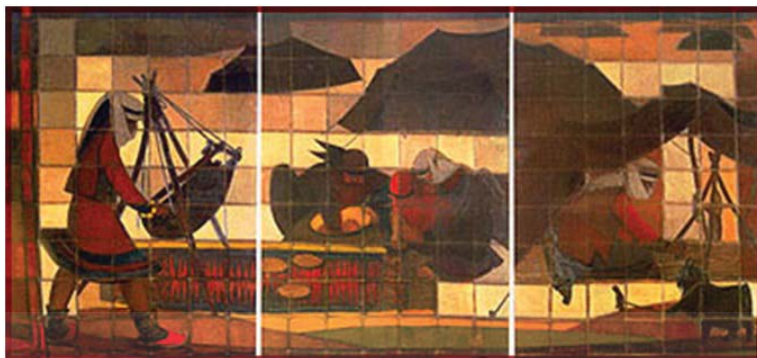
شکل ۷. جلیل ضیاءپور، بدون عنوان