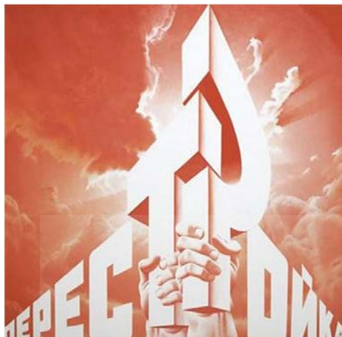
شکل ۴. اریک بولاتوف، اصلاحات، ۲۵، ۱۹۸۹، رنگ روی بوم، ۲۷×۲۷، منبع: نگارخانه فیلیس کایند، نیویورک

تسهیل و تعمیق می‌شود. در ایران نیز علاوه بر عوامل فوق، علی‌الخصوص فقدان و یا درست‌تر بگویم ضعف عناصر مقوم هویت و روح جمعی، سبب‌ساز مهاجرت‌های گسترده در سالیان گذشته بوده است (دینی، ۱۳۸۷). در هر حال مشخص است که وقوع این مهاجرت‌ها، فضای مناسب و زاینده‌ای برای پیوندهای فرهنگی بین مردم مناطق مختلف جهان پدید آورده است و این را می‌توان از دیگر اسباب پدیدار شدن فرهنگ جهانی‌شده و هم از پیامدهای آن به حساب آورد.