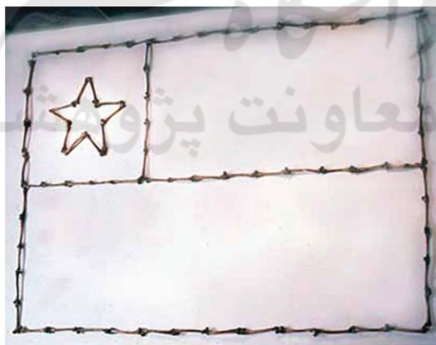
شکل ۵. آرتورو دوکوس، بدون عنوان

بازار گسترده جهانی هنرها نیز در حال حاضر امکان تبادلات و تعاملات فرهنگی و هنری را بسیار افزایش داده است و همین امر به‌طور طبیعی، میل به مطالعات تطبیقی هنر و تقاضای آن را افزون می‌کند. اگرچه خیلی از فعالیت‌های امروزی عرصه‌های فرهنگی-هنری ممکن است به‌طور هدفمند و آگاهانه، گسترش فضاهای تفاهم میان‌فرهنگی را منظور نظر نداشته باشد، اما خواه‌ناخواه نوعی فهم و درک متقابل بین‌فرهنگی را نتیجه می‌دهد. اولین کارکرد بازار جهانی هنر وجه انتفاعی آن است، اما در کنار این می‌توان مشاهده کرد که کلیه برنامه‌ها و جشنواره‌های هنری بین‌المللی به دادوستدهای هنری و فرهنگی بین کشورهای مختلف معونت می‌دهد.