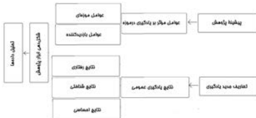
شکل ۳. مدل پیشنهادی برای پژوهش، منبع: نگارندگان

از مطالعات پیشین استخراج شده است، می‌توان به انگیزه، زمان، دانش قبلی، نوع دانش قبلی، تعداد و نوع همراهان بازدیدکننده، بازدیدهای قبلی، سن، جنسیت، ملیت، تعامل با راهنمای موزه، تأثیرات محیط و معماری موزه و شناسنامه آثار هنری و تاریخی اشاره کرد. همچنین می‌توان در نهایت با کنار هم قرار دادن یافته‌های پژوهش و یافته‌های ویلر و هام و شرایط خاص موزه مورد نظر، داده‌های تحقیق را تحلیل کرد.