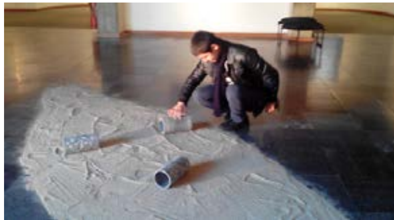
شکل ۳. عوامل فردی در تعامل با آثار هنری در موزه‌های معاصر-تهران

و نگرش آنها، هنگام ورود به محل در سه گروه کم، متوسط و زیاد، می‌تواند بر اعتبار یافته‌های پژوهش بیفزاید؛ زیرا اگرچه هنگام خروج تغییر زیادی در این شاخص‌ها ایجاد می‌شود، اما این میزان تغییر در سه گروه بازدیدکننده یکسان نیست (Falk & Adelman, 2003). فالک و دیگران در مقاله‌ای دیگر ۴۰ بازدیدکننده بزرگسال در نمایشگاه تاریخ ملی زمین‌شناسی، سنگ‌های گران‌بها و مواد معدنی [۱۸] را مطالعه می‌کنند تا با شیوه PMM [۱۹]، تأثیر انگیزه‌ها و استراتژی‌های بازدیدکننده بر یادگیری او را ارزیابی کنند (Falk et al., 1998). پاکر و بلنتاین بر ارتباط یادگیری با انگیزش روحی بازدیدکننده تمرکز می‌کنند. در این مقاله، به‌منظور ارزیابی شباهت‌ها و تفاوت‌ها در سه مکان (موزه، گالری هنری و آبیگاه)، از منظر توقعات بازدیدکننده، درک او از فرصت‌های یادگیری، درگیری در رفتارهای فعال یادگیری و درک او از تجربه یادگیری، پرسش‌نامه‌هایی در اختیار بازدیدکنندگان قرار می‌گیرد. نویسندگان در آغاز از انگیزه‌های بازدیدکننده سؤال می‌کنند و سپس با طبقه‌بندی و تحلیل‌های آماری، رابطه این عوامل انگیزشی را با رفتارهای یادگیری می‌سنجند (Packer & Ballantyne, 2002).