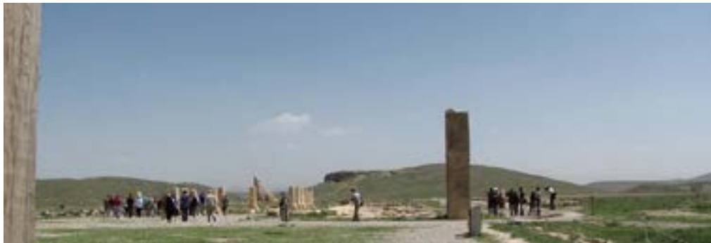
شکل ۲. نمایش بازدیدکنندگان در تعامل اجتماعی، در بازدید از سایت‌های تاریخی - تخت جمشید

فراوانی رفتارهای یادگیری در خانواده‌هایی که از نمایشگاه‌های پیشرفته بازدید کردند، نسبت به خانواده‌های گروه گواه (که نمایشگاه‌های پیش از تغییر را بازدید کردند) بررسی می‌شود. این پژوهش در چهار مرکز علمی در فیلادلفیا صورت می‌گیرد و نشان می‌دهد نمایشگاه‌های پیشرفته، افزایش چشمگیری در شاخص‌های اجرا در پی دارد (Borun et al., 1997). در مقاله بینگمن و دیگران، موزه‌ها مکان‌هایی برای گردش اجتماعی خانواده‌ها قلمداد می‌شود که برنامه‌ریزی مؤثر و هدفمند آموزنده‌های آن برای بازدیدهای چندنسلی خانواده، می‌تواند گردش فوق‌العاده را به تجربه‌ای معنادار، همراه با فرصت‌هایی برای یادگیری تبدیل کند. در این مقاله بر نقش برنامه‌های موزه برای تک‌تک اعضای خانواده در سنین مختلف تأکید شده است، چرا که جذابیت برنامه برای یکی از اعضا می‌تواند کل خانواده را به موزه بیاورد و آنها را به بازدیدکنندگانی پایدار تبدیل کند (Bingmann et al., 2009). کاملیا سنفورد، در مقاله خود در پی پاسخ دادن به این سؤال است که چگونه می‌توان دریافت خانواده‌ها طی بازدید از موزه یاد می‌گیرند؟ او در نهایت بر لزوم مطالعه هم‌زمان شاخصه‌های یادگیری و معنادار بودن این ارتباط تأکید می‌کند (Sanford, 2010).