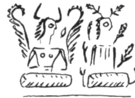
شکل ۱۰. انسان- بالدار در کنار انسان-نبات، اواخر هزاره سوم قبل از میلاد، تپه شهداد، منبع: Lamberg-Karlovsky, 1971, 91