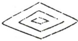
شکل ۱۲. شکل لوزی به عنوان نمادی برای چشم یا اندام تناسلی زنانه، منبع: بلک و گرین، ۱۳۸۳، ۱۲۶