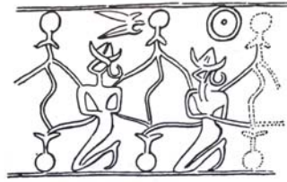
شکل ۲. انسان-ماهی، نقش روی مهر، اواسط هزاره دوم ق.م، چغارنبیل، منبع: پرادا، ۱۳۷۵، ۱