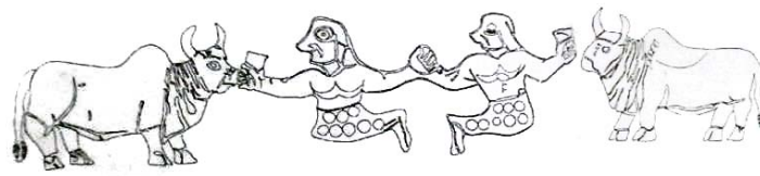
شکل ۵. انسان-ماهی، نقش برجسته روی ظرف سنگی، جیرفت، منبع: مجیدزاده، ۱۳۸۲، ۱۰