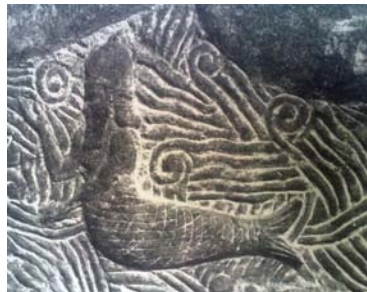
شکل ۷. نقش برجسته انسان-ماهی معروف به کولولو در بین‌النهرین، منبع: بلک و گرین، ۱۳۸۸، ۱۶۰