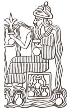
شکل ۶. بخشی از مهرگودآ با تصویر ظرف‌های آب، منبع: بلک و گرین، ۱۳۸۸، ۱۱۵

در باورهای قدیمی و اساطیری نخستین ماهی از اقیانوس مقداری گل بیرون آورد که زمین با آن شکل گرفت و نیز سمبل شروع و آغاز است، آن را بر پشت خود قرار داد که نشانه و مظهر نگهداری و محافظت است. مردمانی را که از سیل و طوفان جان سالم به در برده بودند راهنمایی کرد و نیز آدمیان را از دنیای زیرین به بالا هدایت کرد (جابز، ۱۳۷۰، ۱۳۲).