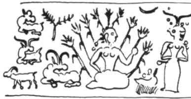
شکل ۱۱. انسان-نبات، اواخر هزاره سوم قبل از میلاد، تپه شهداد یا تپه یحیی