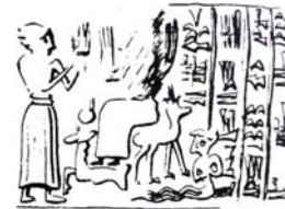
شکل ۱. انسان-ماهی، نقش روی مهر، اواسط هزاره دوم ق.م، چغارنبیل، منبع: Amiet, 1972, 35