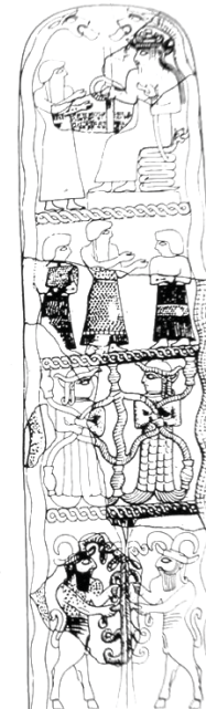
شکل ۴. تصویر انسان-ماهی حکاکی شده بر روی استل اونتاش گال، ۱۳۴۰ تا ۱۳۰۰ ق.م، شوش، منبع: Amiet, 1966, 88