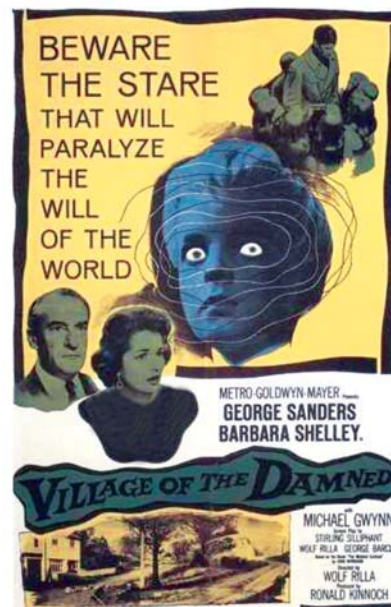
شکل ۶. اعلان فیلم Village of the Damned ارائه شده در سینماهای انگلستان، دهه ۱۹۶۰م