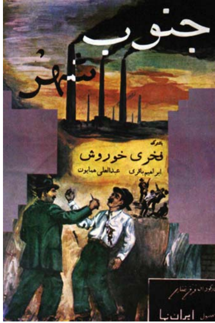
شکل ۱۳. با امضای «کارناوال»، اعلان فیلم جنوب شهر ۱۳۳۷