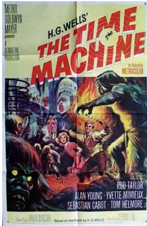
شکل ۵. ویلیام رینولد براون، اعلان فیلم The Time Machine اواخر دهه ۵۰ م. منبع: www.allposters.com

بار پلاکارد فیلم آلمانی «آتش در کوهستان‌ها» را برای سینما «ایران» کشیده است (مهرابی، ۱۳۷۱).