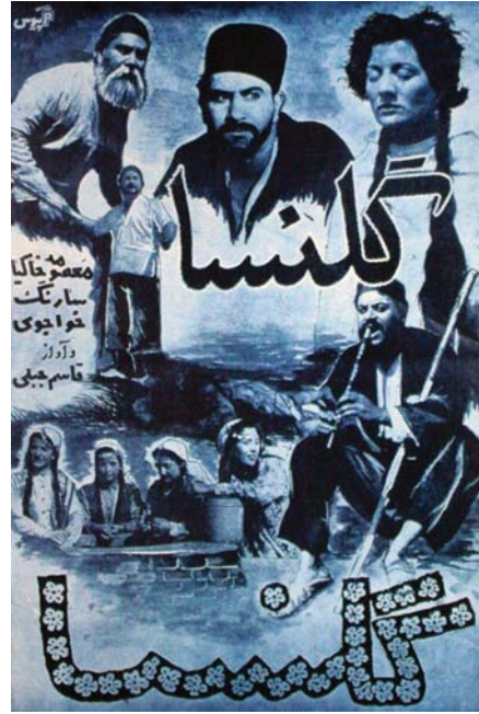
شکل ۱۲. با امضای «پیوس»، اعلان فیلم گلنسا، ۱۳۳۲، منبع: بهارلو، ۱۳۸۳، ۱۶۹

بررسی میزان کاربرد عکس در طراحی اعلان‌های سینمایی دهه سی خورشیدی به دلیل عدم دسترسی به تمامی آثار موجود، بررسی کمی اعلان‌های یک دوره ممکن است به دور از خطا نباشد. اما برای دست یافتن به یک جمع‌بندی نهایی در حیطه طراحی اعلان‌های سینمایی دهه سی خورشیدی ایران، بر اساس اعلان‌های شناسایی شده، آماری تدوین و فراوانی اعلان‌هایی که از عکس بهره گرفته بودند نسبت به تعداد کل اعلان‌های شناسایی شده مشخص گردید. همان‌طور که در جدول ۱ مشاهده می‌شود تعداد کل اعلان‌های شناسایی شده دهه سی، ۲۷ اعلان است که از عکس در طراحی ۵ اعلان از این مجموعه بهره گرفته شده است. از این رو نسبت اعلان‌های بهره گرفته از عکس به کل اعلان‌ها، یا به عبارت دیگر، کاربرد کمی عکس در طراحی اعلان‌های سینمایی دهه سی خورشیدی ایران ۱۸/۵٪ است که نشان از عدم رغبت و استقبال طراحان نسبت به استفاده از عکس در طراحی اعلان‌های سینمایی دهه سی دارد و به لحاظ کمی، دامنه اندک کاربرد عکس در طراحی اعلان سینمایی این دهه را آشکار می‌سازد.