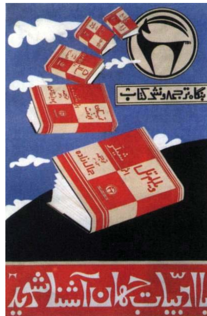
شکل ۱. محمود جوادی‌پور، اعلان برای انتشارات، ۱۳۳۷