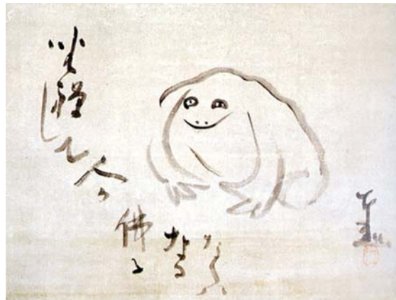
شکل ۵. قورباغه خندان، اثر سنگایی، قرن نوزدهم، مرکب روی کاغذ، ۱۶ در ۲۰/۵ سانتی‌متر، موزه ایدمیتسو توکیو، منبع: Addis, 1989, 56

می‌رسید صدای تالاپا!»، موضوع شعر و طرح سنگائی قورباغه‌ای است که از دیدگاه خود به دنیای آدمیان می‌نگرد. در مذهب زن همه جانداران اعم از باشعور و بی‌شعور سهمی از ذات بودا دارند (تصویر ۵). شعر مطایبه‌آمیز سنگائی گوهری است از فرهنگ زن دوره ادو که آگاهی زن را با نگاهی بازیگوشانه به دنیا می‌آمیزد و تلفیقی می‌سازد که دلسوزی آن برای همه موجودات عالم ضامن بقای آن بوده است.