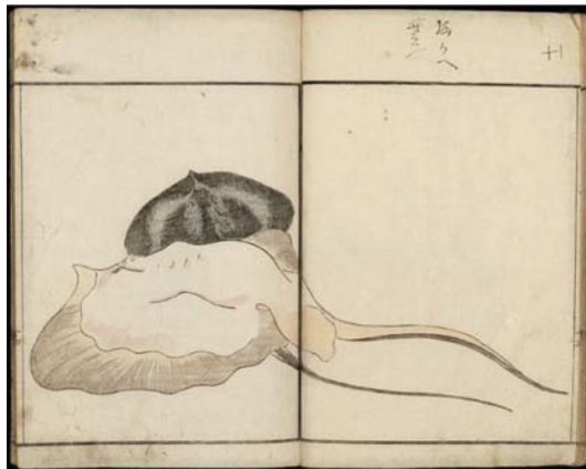
شکل ۳. گیوکایفو، اثر کوواگاتا کی‌سای، ۱۸۰۲ م. چاپ‌نقش روی کاغذ، موزه هنرهای زیبای بوستون، منبع: www.educators.mfa.org

نمونه‌هایی از این دست کم نیستند. باید گفت چشم زیبایی‌شناس ژاپنی سال‌هاست که این ترکیب‌ها را می‌شناسد و به‌کار می‌گیرد. ترکیب‌بندی‌های بدیع و متفاوت تصویرسازی‌های ژاپنی در تمام دنیا مشهورند و برخلاف ترکیب‌های قرینه قرن هجدهم اروپا، ریشه در فرهنگ تصویری قرن دوازدهم ژاپن دارند، در آیینی که تکرار تقارن را کمالی غیرضروری و غیرقرینگی را تازگی ذهن و خیال می‌داند.