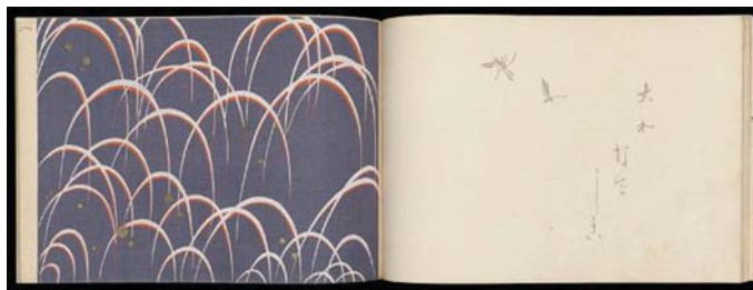
شکل ۷. چهار فصل زرین، اثر تامامورا شیموهیرو، ۱۹۰۳م، کتاب اهون چاپ‌نقش روی کاغذ، ۲۵/۵ در ۳۶/۸ سانتی‌متر، موزه هنرهای زیبای بوستون، منبع: www.educators.mfa.org

برای یافتن چنین مفاهیمی در زمینه تصویرسازی، آثار فراوانی یافت می‌شود که از قرار معلوم از زن تأثیر پذیرفته‌اند، در این بین سهم طومارها و پرده‌نگاره‌ها بیشتر است، اما آثار معاصر هم خالی از این آرمان نیستند. در کتاب شعری با عنوان چهار فصل زرین که توسط تامامورا شیموهیرو [44] با تکنیک اوکیوئه در سال ۱۹۰۳ تصویرسازی شده است، برای تصویر کردن شعری در خصوص فصول، تصویرگر با استفاده از فضایی که بین خوشنویسی تکرنگ و چاپ رنگی ایجاد کرده، مخاطب را در تعلیق میان دو صفحه از کتاب نگاه می‌دارد (تصویر ۷).