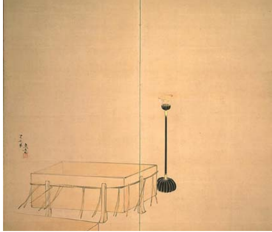
شکل ۸. ایباراکی، اثر شیباتا زشین، دوره میجی، مرکب، رنگ و طلا روی کاغذ، دو جفت دوتایی پاروان تاشو، هر لت ۱۶۶ در ۱۶۸ سانتی‌متر، موزه هنرهای زیبای بوستون، منبع: Murase, 1190, 125

نای شمعدانی و در طعم گس چای سبز بازیافتنی است. سوزوکی، وابی-سابی را «نوعی ادراک زیبایی‌شناسانه فقر» توصیف می‌کند. فقر به‌زعم وی حس عاطفی و رؤیایی زدودن بار سنگین علایق مادی زندگی است (Ando, 2006).