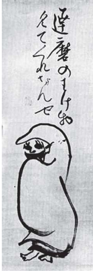
شکل ۴. داروما، اثر سنگایی، قرن نوزدهم، مرکب روی کاغذ، ۱۶ در ۲۰/۵ سانتی‌متر، موزه ایدمیتسو توکیو