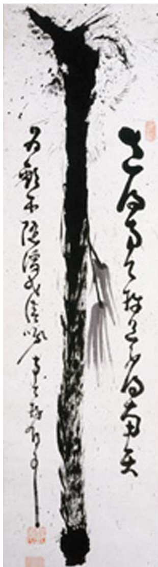
شکل ۶. چوبدست، اثر نانتنبو، قرن ۱۹، مرکب روی کاغذ، ۳۳ در ۱۳۱/۳ سانتی‌متر، مجموعه گیتیر-یلن، منبع: Pollard, 2006, 83

زن، به کرات دیده می‌شود. آثار بی‌شمار طومارهای آویختنی که توسط راهبان دیرها به تصویر کشیده می‌شد و تعداد قابل ملاحظه‌ای در و پاراوان به این شیوه از قرن دوازدهم تاکنون به جای مانده است. بسیاری از این تصاویر با کوان یا هایکویی همراه است. نوشته‌ای که خود در معنا لحظه‌ای را می‌طلبد و البته نحوه اجرای خوشنویسی نیز همچون نقاشی شکلی بداهه‌گونه به خود گرفته است.