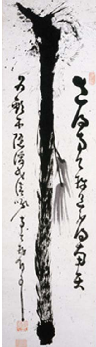
شکل ۶. چوبدست، اثر نانتنبو، قرن ۱۹، مرکب روی کاغذ، ۳۳ در ۱۳۱/۳ سانتی‌متر، مجموعه گیتیر-یلن، منبع: Pollard, 2006, 83

زن، به کرات دیده می‌شود. آثار بی‌شمار طومارهای آویختنی که توسط راهبان دیرها به تصویر کشیده می‌شد و تعداد قابل ملاحظه‌ای در و پاراوان به این شیوه از قرن دوازدهم تاکنون به جای مانده است. بسیاری از این تصاویر با کوان یا هایکویی همراه است. نوشته‌ای که خود در معنا لحظه‌ای را می‌طلبد و البته نحوه اجرای خوشنویسی نیز همچون نقاشی شکلی بداهه‌گونه به خود گرفته است.