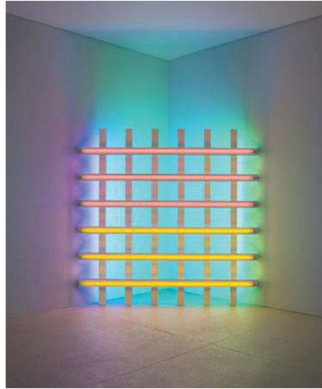
تصویر ۳. دن فلاوین، «بدون عنوان (به افتخار هارولد یواخیم، ۲)»، ۱۹۷۷، لامپ مهتابی بنفش، زرد، آبی، و سبز، منبع: themodern.org

تعین)، عینیت ندارد. بنابراین وجود اثر فلاوین از جوهری غیر عینی ساطع یا حادث شده است. اما اثر کاندینسکی، هیچ جوهر عینی یا غیر عینی را بازنمایی نمی‌کند، بلکه خود جوهری عینی حاصل از جوهر ذهنی است و به‌عنوان حدوث اول شناخته می‌شود و هرگز بازنمایی درجه دو یا سه نمی‌تواند باشد، چرا که اصلی جز خودش ندارد.