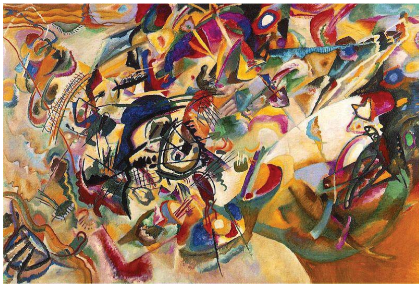
تصویر ۲. واسیلی کاندینسکی - «ترکیب‌بندی شماره ۷» - ۱۹۱۳، رنگ روغن روی بوم

چنانکه از بحث در باب نسبت‌مندها دانستیم از نگر ارسطو، چهار نوع نسبت‌مند را می‌توانیم شناسایی کنیم. نسبت‌مندهای زبانی، برای مثال در ترکیبات اضافی و یا ترکیباتی که در آنها حرف اضافه به‌کار می‌رود و یا در صفات تفضیلی و عالی. نسبت‌مندهای متضاد، در بحث صفات. نسبت‌مندهای ذاتی، در مورد چیزهایی که وجود و چیستی رابطه‌شان با دیگر چیزها از معنای درونی آنها برمی‌آید. و نسبت‌مندهای فعلی-انفعالی، در انجام گرفتن کاری از طرف چیزی و یا پذیرا شدن کار یا عملی (و یا آثار آن) از طرف چیزی. از میان این نسبت‌مندها، نسبت‌مندهای متضاد امکان مقایسه و ارزش‌گذاری بین دو ابژه را فراهم می‌آورند. ظاهراً تنها جایی که ارسطو وارد بحث مقایسه ارزش‌گذارانه با رعایت معیارها و موازین منطقی شده است، در صحبت از صفات تفضیلی و عالی است.