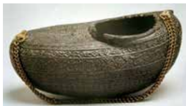
شکل ۵. کشکول. ایران. با تصویری از چند درویش و شیران رام شده. ۱۲۸۰ق، ۲۶×۱۳٫۸ سانتیمتر، منبع: Akbarnia, 2010, 28

شکل دیگری از حضور شیر، بر روی بدنه کشکول هاست. بر روی کشکولی از موزه بروکلین تصویر چند درویش به همراه شیرانی رام شده به چشم می‌خورد (شکل ۵). لادن اکبرنیا در تشریح این کشکول می‌نویسد: «در صورت تعلق به یک درویش [یا قلندر]، این احتمال هست که وی خود هنرمند بوده و یا شاید هم به عضوی از اصناف هنرمندان ایران یا عثمانی با تمایلات شدید عرفانی تعلق داشته است» (Akbarnia, 2010, 28,29). در اینجا نه تنها موضوع، که رسانه انتقال موضوع یعنی کشکول از آن یک قلندر است.