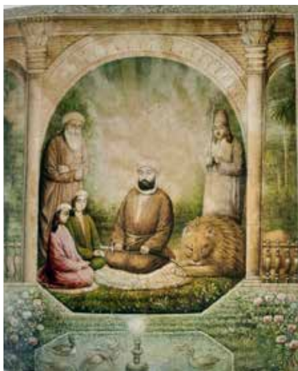
شکل ۲۰. تصویری آشنا برای نقاشان قلندر، سلمان و قنبر همراه با علی، حسن و حسین (علیهم السلام) و شیر رام در پای آنان. اسماعیل جلایر، نیمه دوم قرن ۱۹ میلادی، آبرنگ مات و طلا بر روی کاغذ. ۱۳×۱۵٫۳ سانتیمتر، موزه هنرهای زیبا، هوستون، منبع: Akbarnia, 2010, 21

و توق [۴۱] و چراغ به دست گرفتن است: امیر(ع) [نیزه خود] را به حسان داد و فرمود که پیوسته با خود نگاه دارد. حسان نیزه را قبول کرد و آن، علامت مداحان شد و آن را «الف» گویند» (محبوب، ۱۳۵۰، صدودو و صدوسه).