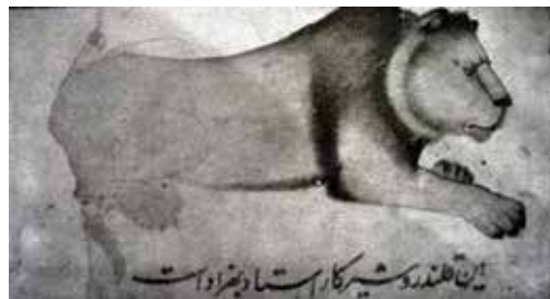
شکل ۱. شیر زنگواره‌به‌گردن و زنجیربه‌پا. منسوب به کمال‌الدین بهزاد. از مرقع بهرام‌میرزا، ربع اول قرن شانزدهم، ایران، رنگمایهٔ مات و جوهر بر روی کاغذ. کتابخانهٔ کاخ موزهٔ توپقاپی. ۱۳×۲۴/۴ سانتیمتر، منبع: آژند، ۱۳۷۷، ۱۶۹