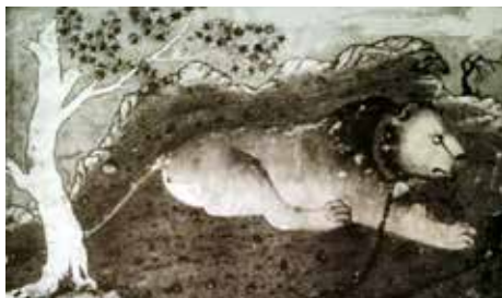
شکل ۲. شیر زنگواره‌داری که به زنجیر بسته شده. نقاشی با رنگمایهٔ مات و طلا بر روی کاغذ. کتابخانهٔ کاخ موزهٔ توپقاپی، مرقع بهرام‌میرزا، منبع: راکسبره، بی‌تا، ۸۹

از همین روی است که می‌توان احتمال داد بعضی معناها که با آثار نقاشانی چون میرک، بهزاد، رضا عباسی و یا دیگران گره خورده، در زمانهٔ خود آنها تنها در سطح ناخودآگاه آثارشان وجود داشته است. عملاً نگارگر فقط بعضی از جنبه‌های قوانین یا برخی از موارد کاربرد آن را در محدودهٔ حرفه‌اش که تابع قوانین گروهی و خاصی بوده، می‌شناخته است. این قواعد حرفه به وی امکان می‌داد که مجلسی نقاشی کند، شمایی بسازد، یا به شیوه‌ای که از لحاظ طریقت و گروه درست و معتبر بوده به کار پردازد، بی‌آنکه الزاماً معنای عمیق نهادهای اجتماعی یا جهان‌بینی‌ای که متأثر از آن، اثر خود را خلق می‌کرده، بداند و بشناسد. این سنت و گروه بوده که با منتقل کردن نمونه‌های متعدد و قواعد کار از نسلی به نسل دیگر، ضامن اعتبار اجتماعی صورت‌های بصری می‌شده است. ضرورت کشف طبقهٔ اجتماعی [۲۰] یا گروه خالق نقاشی‌های مذکور در این بحث نیز از همین روی است. آنها نیز زادهٔ نفس‌های مجرد نیستند بلکه فرآوردهٔ یک آگاهی جمعی مشترک‌اند.