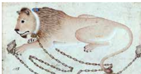
شکل ۴. شیر زنگواره دار در زنجیر. منسوب به استاد مراد. جوهر، طلا و رنگمایه مات بر روی کاغذ. نیمه سده دهم ق. بستان، موزه هنرهای زیبا.

(راکسبره، بی تا، ۸۸) و ذکر توأمان نام قلندر و شیر، می‌تواند توضیحی بر هر دو نگاره حاضر در یک صفحه باشد، اما بعید هم نیست که ذهن مخاطبی که بعدها قطعه خوشنویسی را وارد تصویر کرده، به ضرورت پیوند اجتماعی میان شیر و قلندران، اضافه نمودن نام قلندر به نگاره را ضروری پنداشته باشد. حتی قرار دادن این دو نگاره در یک صفحه از مرقع نیز می‌توانست بادلایل و از روی عمد باشد. «در چند برگه پس از آن نیز در همین مرقع، اجرایی رنگی از نقاشی همین شیر چمباتمه زده زنگواره دار و به زنجیر بسته شده دوباره پدیدار می‌گردد (شکل ۲). در اینجا شیر مذکور، ممکن است به تقلید از طرح بهزاد که دوست محمد طرح را به وی منسوب می‌دارد، صورت گرفته باشد» (راکسبره، بی تا، ۸۸ و ۸۹).