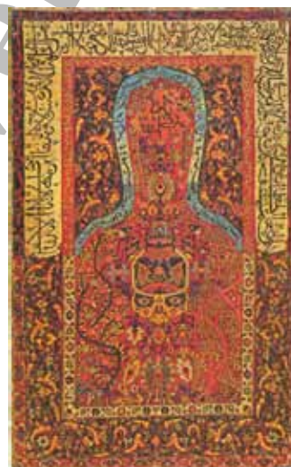
شکل ۱۴. مضمون خط‌نوشته: آیات مذهبی، قالیچه محرابی، قاجاریه، احتمالاً مشهد، موزه آستان قدس رضوی، ۱۷۷ × ۱۲۰ سانتی‌متر