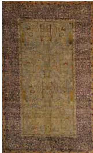
شکل ۱۲. مضمون خط‌نوشته: اجتماعی (مبارک‌باد)، قالی درختی (مبارک‌باد)، صفویه، تبریز، موزه فرش ایران، ۲۵۰ × ۱۵۵ سانتی‌متر، منبع: دادگر، ۱۳۸۰، ب: ۶

موضوعات داستانی و حکمی برگرفته از شاهنامه فردوسی و خمسه نظامی، گروه دیگری از قالی‌های قاجار را تشکیل می‌دهند که حضورشان بیشتر در طرح‌های تصویری است. شکل ۱۱، قالی‌ای را با ساختار قابی نشان می‌دهد که در هر قاب آن یکی از داستان‌های شاهنامه به تصویر درآمده و ابیات مربوط به هر داستان نیز در حواشی قاب‌ها بافته شده است. شکار بهرام گور به همراه کنیز محبوبش آزاده، که دو شاعر بزرگ ایران یعنی فردوسی و نظامی حکایت آن را به نظم کشیده‌اند، موضوع تعدادی دیگر از قالی‌های تصویری دوره قاجار است. چند نمونه از این قالی‌ها که در موزه فرش ایران نگهداری می‌شوند، مزین به ابیاتی از کتاب خمسه نظامی‌اند.