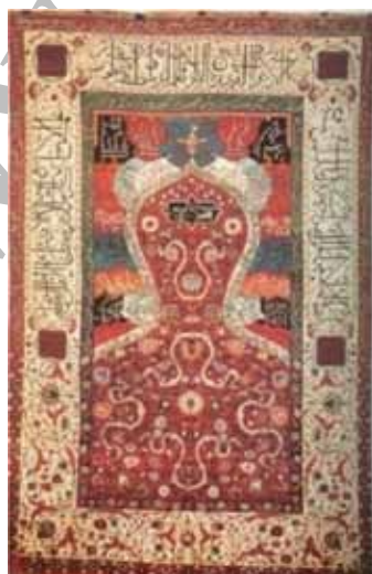
شکل ۱۵. مضمون خط‌نوشته: آیات مذهبی، قالیچه محرابی، صفویه، شمال غرب ایران، موزه متروپولیتن، ۱۶۱ × ۱۰۷ سانتی‌متر، منبع: پوپ، ۱۳۸۷، لوح ۱۱۶۷

در دوره صفوی قالیچه‌های سجاده‌ای یا محرابی به واسطه کاربرد آنها برای نمازگزاران، معمولاً در نیمه فوقانی طرح، به خطوط عربی حاوی آیات و عبارات مذهبی مزین بوده‌اند. نوع خط در این قالیچه‌ها، نسخ و ثلث و کوفی است [۲۲] (شکل ۱۴). بافت قالیچه‌هایی از این دست در دوره قاجار چندان تداومی نیافت؛ مگر معدود قالیچه‌هایی که به تقلید از نمونه‌های صفوی بافته شده‌اند (شکل ۱۵).