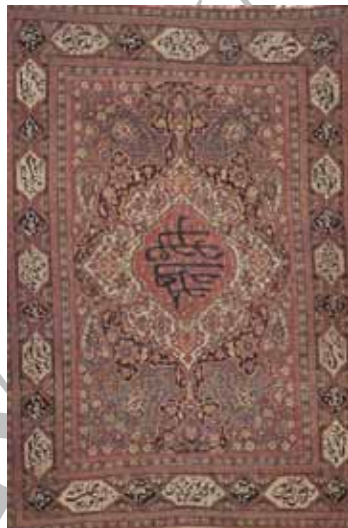
شکل ۹. مضمون خطنوشته: عرفانی، قالی تصویری نورعلیشاه، قاجاریه، کاشان، موزه فرش ایران، ۲۰۰ × ۱۳۳ سانتی‌متر (آرشیو موزه)