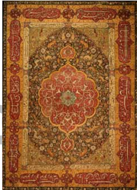
شکل ۵. مضمون خط‌نوشته: توصیفی (وصف فرش)، قالی لچک‌ترنج (سالتینگ)، صفویه، تبریز، موزه فرش ایران، ۲۳۰ × ۱۶۶ سانتی‌متر، منبع: دادگر، ۱۳۸۰، ج: ۲۳.