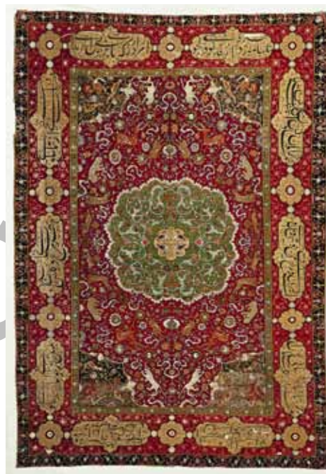
شکل ۳. مضمون خط‌نوشته: غنایی، قالی لچک‌ترنج (سال‌تینگ)، صفویه، تبریز، موزه فرش ایران، ۲۵۲ × ۱۶۷ سانتی‌متر، منبع: دادگر، ۱۳۸۰، ج: ۲۵