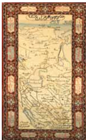
شکل ۱۳. مضمون خط‌نوشته: اجتماعی (تمجید از صنعت و مجلس)، قالی تصویری با موضوع نقشه ایران، قاجاریه (۱۹۲۵/۱۳۴۴)، تهران، موزه فرش ایران، ۱۶۸ × ۱۰۵ سانتی‌متر. آرشیو موزه.

ابیاتی در وصف صنعت و دانش و مجلس بافته و شرایط اجتماعی زمان خود را به نوعی بازتاب داده‌اند [۲۱] (شکل ۱۳).