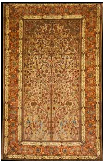
شکل ۴. مضمون خط‌نوشته: غنایی و توصیفی (طبیعت بهاری)، قالیچه محرابی، قاجاریه، کاشان، ۲۰۶ × ۱۲۸ سانتی‌متر، موزه فرش ایران، آرشیو موزه