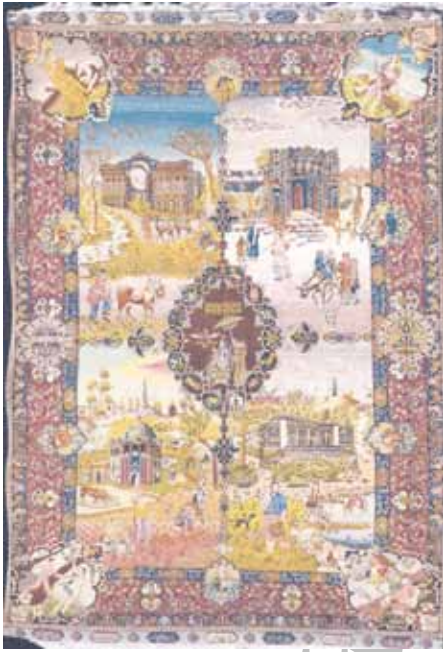
شکل ۶. مضمون خط‌نوشته: توصیفی (وصف فرش)، قالی تصویری چهارفصل، قاجاریه، تبریز، موزه فرش ایران، ۲۹۸ × ۲۲۰ سانتی‌متر

در حاشیه قالی بافته شده است. نمونه‌های متعددی از این قالی‌ها در موزه فرش ایران نگهداری می‌شوند، و قالی سلاطین ایران در شکل ۷ یکی از آنهاست.