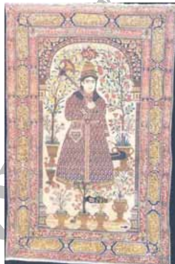
شکل ۱۰. مضمون خطنوشته: مدح شاه، قالی ترنج‌دار (نوظهور)، قاجاریه، راور کرمان، موزه فرش ایران، ۱۸۶ × ۱۳۰ سانتی‌متر

مدح و ستایش شاه حاکم، هم در خطنوشته‌های قالی‌های دوره صفوی به چشم می‌خورد و هم در قالی‌های قاجار. این قالی‌ها که به عنوان پیشکش یا هدیه برای شاه یا حاکم ولایت بافته شده‌اند، بالطبع در زمره قالی‌های نفیس هر دوره به‌شمار می‌روند. نمونه‌ای که از دوره صفوی ارائه می‌شود (شکل ۸)، مزین به ابیاتی است به خط نستعلیق و به رنگ تیره که بر زمینه روشن کتبی‌ها بافته شده‌اند [۱۶]. این شعر که در چند نمونه دیگر از قالی‌های صفویه نیز به کار رفته، ضمن تمجید از حاکم زمان و فرشی که مختص وی بافته شده است، خوشی و دوام سلطنت را برای او آرزو می‌کند. اشاره شاعر این ابیات به فرش، گویای آن است که او شعر را خاص این فرش یا نمونه‌های مشابه آن سروده است. قالیچه ترنج‌دار موزه فرش ایران در شکل ۹، نمونه‌ای است از دوره قاجار. مضمون ابیات بافته‌شده در حاشیه و عبارت «جهان را مبارک باد» در ترنج، نشان می‌دهد که این قالیچه نیز اثری سفارشی است. شاعر این ابیات با تشبیه قالیچه بافته‌شده به قالیچه حضرت سلیمان، هم به نوعی به خاص بودن و منزلت بالای قالیچه اشاره کرده و هم مالک قالیچه - یعنی حاکم - را ارج و قربی فراوان بخشیده است. این شعر که دوبیتی است [۱۷]، چهار بار تکرار گردیده و میان هر مصرع نیز کلمه «نوظهور» [۱۸]، به عنوان مشخصه یا مارک تولیدکننده قالی بافته شده است.