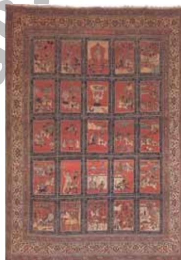
شکل ۱۱. مضمون خط‌نوشته: داستانی و حکمی، قالی تصویری (شاهنامه)، قاجاریه، (۱۸۰۹-۱۸۰۵ / ۱۲۲۰-۱۲۲۴)، تبریز، موزه فرش ایران، ۴۲۵ × ۳۵۶ سانتی‌متر،