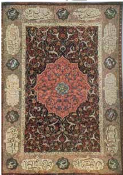
شکل ۸. مضمون خط‌نوشته: مدح شاه، قالی ترنج‌دار، صفویه، راور کرمان، مجموعه علی ابراهیم پاشا، ۲۲۸ × ۱۶۷ سانتی‌متر، منبع: پوپ، ۱۳۸۷، لوح ۱۱۵۹