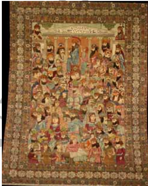
شکل ۷. مضمون خط‌نوشته: توصیفی (معرفی اشخاص)، قالی تصویری مشاهیر، صفویه، کرمان، موزه فرش ایران، ۳۶۲ × ۲۷۰ سانتی‌متر