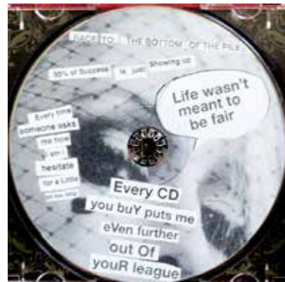
تصویر ۶: آلبوم پاریس (URL6)

او دیوارنگاره ماجرای کانای آیلند ۳۳ (تصویر ۷) را در ۲۰۱۸م. در محله‌ای به همین نام در جنوب بروکلین نیویورک نقش نمود. این اثر تأثیرگذار، نشانگر شخصی است که گروهی از مردم را از زمین‌هایشان اخراج می‌کند. کیف و جامه رسمی او پیوندش را با طبقه دارا آشکار می‌سازد و کلاه ایمنی سرش اشاره‌ای به آمادگی وی برای آغاز عملیات ساختمانی در این ناحیه است. تنها بخش رنگی اثر تازیانه‌ای است که او بالای سر می‌چرخاند. در این اثر از تازیانه، نشانه باستانی استیلای نیرومندان، آشنایی‌زدایی شده تا یک نمودار رشد اقتصادی را فرایاد آورد و گویای ثروتی باشد که