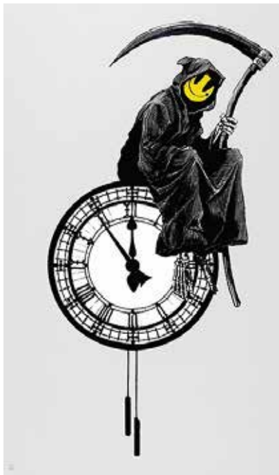
تصویر ۱۰: نیشخند دروگر (URL10)

بود؛ اما اکنون این جشن به تعطیلاتی برای خوشگذرانی و اسرافگری بیمارگونه و رویداد پرسودی برای بازارها و صنایع ترویج‌گر مصرف‌گرایی بدل شده است. اندام عیسی و کالاهای آویخته از دستان او ذوب‌شده و در حال فروریختن است، گویا هنرمند خواسته به مخاطبانش زنه‌ار دهد که نه باور مذهبی آن‌ها دیگر استحکامی دارد و نه خوشی‌های مادی‌شان دوامی خواهد داشت. بنکسی با شکستن ساختار محوری‌ترین نشانه و شمایل مذهبی غرب، رفتار مردمان جامعه‌اش و اسارت آن‌ها بر صلیب مصرف‌گرایی لجام‌گسیخته را به بوت‌ه نقد می‌برد.