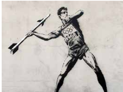
تصویر ۵: موشک به‌جای زوبین (URL5)

بنکسی شش سال بعد تصویری با مضمون همسان را بر دیوار یک انبار قدیمی در وست‌وود کالیفورنیا نقش می‌زند که به تیرانداز مدادشمعی‌ها ۳۹ (تصویر ۴) شهرت یافته. قهرمان اثر او این بار پسرپچه‌ای است که قنداق تیرباری را بر شانه نهاده و سر آن را رو به دوردست‌ها گرفته است. شوک نخست به بیننده را دیدن مسلسلی در آغوش یک نونهال وارد می‌کند؛ به‌ویژه آن‌که بلندای اسلحه با قد بچه یکسان است و بار سنگینی آن عضلات سیمایش را به هم فشرده، اما پیام اثر هنگامی منتقل می‌شود که به پیرامون شخصیت محوری بنگریم. جز پسرپچه و تیربارش سایر عناصر این دیوارنگاره رنگی هستند. خورشیدی که بر شانه او می‌تابد، فرش سبزه‌ها که پاهایش را پوشانده و پروانه‌های سرخوش میان گل‌های شکفته همه به شیوه‌ای رسم شده‌اند که گویی نقاشی خام‌دستانه یک کودک هستند. محور نشانه‌شکنی اثر، قطار فشنگ آویخته از اسلحه است که در خانه‌های آن به‌جای گلوله، مدادشمعی نهاده شده است. پسرپچه دنیای اطرافش را با نقش‌های خیال‌برانگیز طبیعت زنده آذین بسته و اکنون عزم آن دارد که ابزار نقاشی‌اش را به جهان هبه کند. گلوله‌ای که قرار بود این مسلسل شلیک کند کارش جان‌ستاندن است، اما حالا مدادهای شمعی نشسته به‌جای آن، زندگی هدیه می‌کنند.