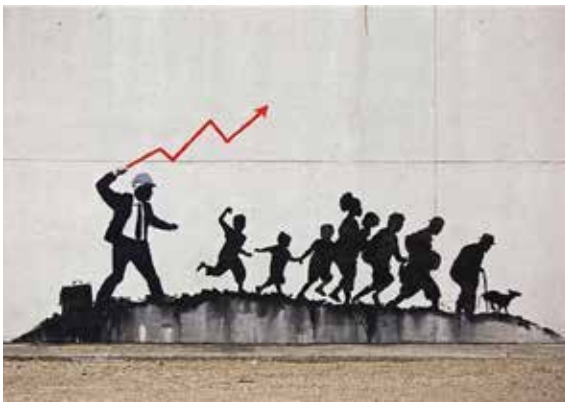
تصویر ۷: ماجرای کانای آیلند (URL7).