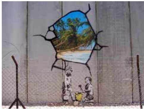
تصویر ۲. مداخله ناخوش‌آیند (URL2)

الف) آشنایی‌زدایی و نشانه‌شکنی سیاسی: این شیوه از تلاش برای آشنایی‌زدایی و بازتعریف نشانه‌ها را می‌توان در یکی از آثار مشهور بنکسی به نام دختر ناپالم یا نمی‌توانم بر این احساس غلبه کنم ۲۵ (تصویر ۱) پی‌جویی نمود. بنکسی این نقاشی چاپ اسکرین را با ارجاع به عکسی دردناک بازمانده از ۱۹۷۲م. نقاشی نموده است؛ یادگار تکان‌دهنده‌ای از جنگ ویتنام که دختری به نام کیم فوک ۲۶ را نیمه‌سوخته در آتش بمباران روستایش در حال دویدن لابه‌لای گروهی از سربازان تصویر می‌کند. بنکسی در نقاشی خود دو نماد نامدار فرهنگ و اقتصاد امریکایی میکی‌ماوس و رونالد مک‌دونالد را دو سوی دخترک پریشان تصویر کرده، درحالی‌که خرامش آسوده و لبخند گشوده نشسته بر چهره آنان بر پیچیدگی شوم اثر می‌افزاید. بنکسی نشانه قابل‌فهم سرباز را که شناسه‌اش یونیفرم، کلاه و رزم‌افزاری برای جنگیدن و کشتن است، از پیرامون دختر نوجوان حذف نموده و به‌جای آن دو نشانه دوستانه و آرامش‌بخش نهاده است؛ موش مهربانی که یادآور خاطرات شاد و دلپذیر ما از محصولات صنعت فرهنگ آمریکایی است و دلچکی مسخره که پذیرش گسترده غذاهای آماده خوشمزه اما ناسالم را در سبک زندگی امروزی فریاد می‌آورد. کنار هم نشستن این سه شخصیت، روایت را از بن تغییر می‌دهد؛ میکی و رونالد داستان کیم نوجوان را گرفته‌اند، گویی او را محاصره کرده و به‌زور با خود می‌برند. چهره شادمان این دو تن خبر از آن می‌دهد که فریادهای دخترک را نمی‌شنوند یا نادیده می‌گیرند. حاصل این ترکیب، گزندگی نیرومندی دارد که از کشف پیوند میان جنگ‌طلبی و سرمایه‌داری (به‌عنوان دو بازوی اصلی هژمونی امریکا) حاصل می‌شود.