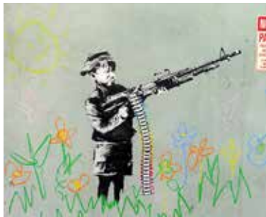
تصویر ۴. تیرانداز مدادشمعی‌ها (URL4)

او در چند نگاره دیگر نیز در این منطقه از نقش کودکان بهره برده، از جمله دختر بچه‌ای که تلاش دارد به یاری خوشه‌ای از بادکنک‌ها به بالای دیوار پر بکشد و دخترک دیگری که یک سرباز را به اسارت گرفته و تفتیش می‌کند. دو پس‌ریچه این دیوارنگاره اما با آرامش مشغول ماسه‌بازی در ساحلی خیالی هستند. بالای سر آن‌ها دیوار ترک‌خورده و از درون توهم حفره باز شده می‌توان تصویر رنگارنگ سایش موج‌ها بر ساحل گرمسیری را زیر سایه نخل‌های خمیده دید. بنکسی این نقاشی را در حالی به پایان برده که چند سرباز اسرائیلی سلاح‌های خود را به سویش نشانه گرفته و با شلیک‌های هوایی او را تهدید می‌نموده‌اند (Duncan, 2019). بیانیه او در پی آفرینش این آثار نشان می‌دهد دغدغه‌های اجتماعی برای او اهمیتی فراتر از اهداف زیبایی‌شناختی دارند: «دولت اسرائیل دست به ساخت دیوارهایی پیرامون سرزمین‌های اشغالی فلسطین زده که بلندیشان سه برابر دیوار برلین است و درازایشان سرانجام به بیش از ۷۰۰ کیلومتر -فاصله لندن تا زوریخ- خواهد رسید. احداث این دیوارها بر پایه قوانین بین‌المللی غیرقانونی است و فلسطین را به بزرگ‌ترین زندان جهان تبدیل می‌کند» (Jones, 2005).