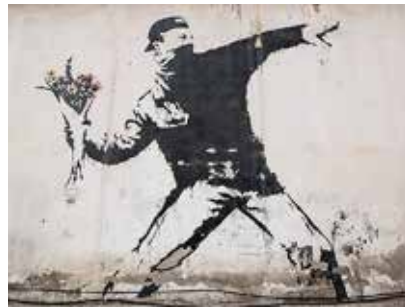
تصویر ۳. طغیان، پرتابگر گل (URL3)

همچون بیشتر دیوارنگاره‌های اعتراضی معاصر، اینجا نیز پاره‌ای از معنای نشانه‌ای توسط مکان و بستر خلق اثر ایجاد می‌شود؛ دیواری که کارکردش حصر یک گروه انسانی و جدایی نژادی میان دو ملت است. آنچه هنرمند دست به آشنایی زدایی و نشانه‌شکنش زده خود دیوار است، به مثابه یک پندار جان‌گرفته برای سد بستن و گسستن پیوند میان انسان‌ها. دیوار که خاکستری است و ضخیم و سترگ، در اثر او سست می‌شود و ترک می‌خورد تا جایی که به پنجره‌ای برای بازنمایی یک چشم‌انداز رنگی بدل می‌گردد. دیوار اکنون دیگر نه یک حصار غیرقابل عبور، بلکه روزنی گشوده برای گذر است. بیننده خبر دارد که در پس این دیوار نیز بیابانی دیگر است همین‌گونه خشک و بیرنگ و شاید به همین اندازه نومید و محزون؛ بنابراین بنکسی تلاشی برای ترسیم یک سرزمین رؤیایی با آدم‌های خوشبخت در آن سوی دیوار ندارد، بلکه از آینده‌ای روشن‌تر برای نسل نوپای ساکن این سرزمین پس از فرو ریختن دیوار سخن می‌گوید. طغیان، پرتابگر گل ۳۸ (تصویر ۳) دیوارنگاره‌ای است که در کنار گاراژی در حاشیه بیت‌المقدس تصویر گردیده. این ترکیب نیرومند پس از آن بارها توسط هنرمندان دیگر بازتکثیر شده است. شخصیت اصلی اثر پسری است که نقاب کلاهش را به پشت چرخانده و نیمی از سیمایش در پس دستمالی (برای ناشناس ماندن یا مقاومت در برابر گاز اشک‌آور) پوشانده شده. این جامه نشان‌دهنده شرکت او در یک شورش خیابانی است و شیوه ایستایی‌اش که گویی در حال پرتاب یک کوکتل مولوتوف است کنش اعتراضی او را برجسته‌تر می‌سازد، اما آنچه او قصد افکندن به سوی جبهه رویارویش را