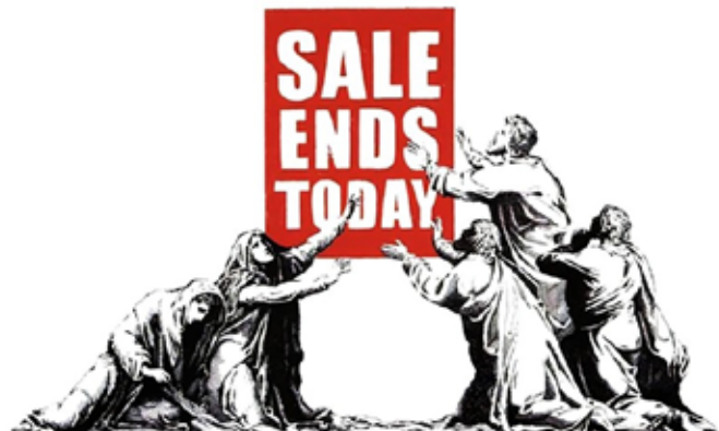
تصویر ۱۱: پایان حراج (URL11)

نشانه اصلی اما در سیمای فرشته مرگ رخ داده است؛ جایی که انتظار می‌رود باشلق ردا بر مجسمه‌ای تهی فرو بیفتد. بنکسی به‌جای این مجسمه ترس‌آور که در سنت مسیحی نماد عبارت رمی ممنتو موری ۴۹ (مرگ را فراموش مکن) است، یک صورتک متبسم نهاده که تنها پاره رنگی تصویر به شمار می‌رود. زردی رنگ این چهره شکفته و سرخوش به‌تندی نگاه مخاطب را به خود جلب می‌کند و پس از آن دیگر نمی‌توان مرگباری او را جدی گرفت. کج نشستش بر بالای ساعت، شیوه آویختن پاهایش و حتی داس خمیده‌ای که به دست دارد اکنون بیش از آن بازیگوشانه و خنده‌آور به نظر می‌رسند که بتوانند بیننده را به هراس بیندازند. پیام هنرمند شاید همین بوده است. مرگ ممکن است نزدیک به نظر برسد، اما پذیرش آن چندان نیز نباید وحشت‌زا باشد.