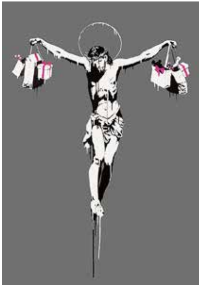
تصویر ۹: مسیح با کیسه‌های خرید

در سال ۲۰۰۳م. با کنایه به مذهب آفریده، مریم زهرآگین ۴۴ (تصویر ۸) نام گرفته است. نخستین نشانه شکسته شده در این اثر عنوان آن است که اشاره به عبارت مریم پرستار ۴۵ یکی از مهم‌ترین