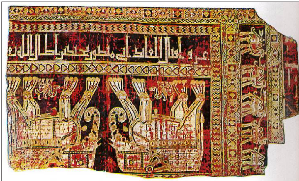
تصویر ۲۳: کتیبه پارچه سامانی شیوه نمایش تزئین مثلثی یا دو شاخه‌ای بر سر حروف (Hillenbrand, 1999: fig: 34)

چنانکه ملاحظه شد، مطالعه تطبیقی شیوه نوشتاری مهرهای موزه ملی با سایر خطوط مهرها، سکه‌ها، بناها و آثار هنری متعلق به سده‌های نخستین اسلامی، تاریخ‌گذاری پیشنهادی را مورد تأیید قرار می‌دهد. به دلیل ویژگی‌های مشترک خطوط، نمی‌توان مرزبندی زمانی صریح و قاطعی را برای مهرها در بازه زمانی سده دوم تا ششم هجری قمری در نظر گرفت، چراکه بسیاری از سنت‌های خوشنویسی طی سده‌ها مورد استفاده قرار گرفت و محدود کردن آن به زمانی خاص، کار بسیار مشکلی است. شاید بتوان با بررسی مجموعه‌های دیگر به شاخصه‌های محدودکننده بیشتر و دقیق‌تری از سبک‌های خوشنویسی مهرها دست‌یافت. بررسی و تحلیل خطوط نشان می‌دهد که آن‌ها از الگو و اصول سبکی مشترکی پیروی کرده‌اند. خطوط مهرها در ترکیب‌های مختلفی ظاهر شده است. به دلیل قابلیت تصویری خط کوفی، حروف از فرم‌های متنوع هندسی برخوردار هستند. با بررسی رسم‌الخط پنج مهر موزه ملی می‌توان ویژگی‌های بصری و تغییرات خطوط از شکل ساده‌نویسی تا فرم پیچیده و تزئینی را مشاهده کرد، به طوری که در نگارش مهر شماره ۵، نهایت دقت و روش‌های بدیع به‌کاررفته و به اشکال بصری در ترکیب‌بندی خط توجه شده است. حرکت پویا و روان خطوط در جهت عمودی، افقی و منحنی دیده می‌شود. ویژگی مشترک میان آن‌ها را می‌توان در ساختار هندسی حروف دانست که معرف خط کوفی ساده و تزئینی است. اصولاً تنوع حروف خط کوفی را باید از ویژگی‌های ذاتی نوشتار کوفی دانست. افزون بر این، بر سر اکثر حروف به‌خصوص مهرهای شماره ۳-۵ و نیز در انتهای برخی از حروف، شکاف مثلثی، دو زبانه یا دو دم قرار دارد. با استفاده از این شیوه، توازن خط در بالا