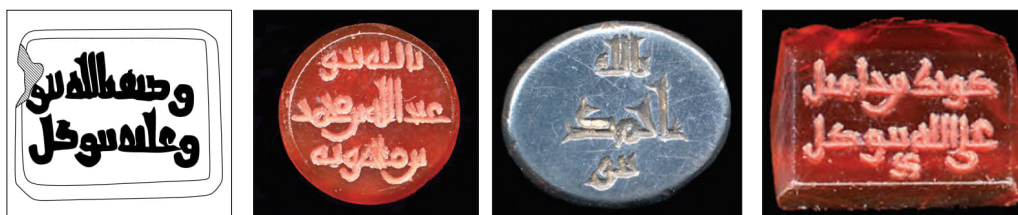
تصویر ۱۷: مهرهای موزه بریتانیا (Porter, 2011: Cat. 152, 157, 190) و ترسیم خط مهر شماره ۴

مهر شماره ۴ که عبارت «و صفی بالله یثق و علیه یتوکل» بر آن نوشته شده، با توجه به سبک نگارش آن یعنی حروف زاویه دار و به شکل دو شاخه، متعلق به سده سوم تا ششم هجری قمری است (Porter, 2011: 15, 24). «بالله یثق» به صورت عبارت دعایی «بِاللَّهِ أَثِقْ» در کتب ادعیه و نیز عبارت قرآنی «عَلَيْهِ يَتَوَكَّلْ» در آیه ۳۸ سوره زمر آمده است. مفهوم آن بسنده کردن اعتماد و تکیه کردن بر خدا در امور زندگی است، اما ترجمه کل جمله چنین است: منزله است کسی که فقط به خدا اعتماد دارد و بر او توکل می کند. البته کلمه صفی در اینجا به صورت اسم خاص نیز می تواند به کار رفته باشد، چنانکه در دو مهر موزه بریتانیا (تصویر ۱۲) نیز به صورت اسم اعلم آمده است. در این دو مهر، نام عبدالله بن محمد و احمد در سطور میانی مهرها دیده می شود. مضمون این جمله، عبارتی پندآمیز و ارشادی است. ویژگی حروف کوفی مهر شماره ۴، گردش نرم و روان حروف به شکل انحنادار است که در خوشنویسی مستدیر خوانده می شود (رضائی باغبیدی، ۱۳۹۳: ۳۹۹). این شیوه در نمایش حروف «و»، «ق»، «ک»، «ل» دیده می شود. همچنین ضخامت یا قطر زیاد خط و یکسانی در وزن حروف از دیگر خصوصیات آن است. این امر موجب شده تا خط متعادل و متناسب به نظر برسد. دو شاخه شدن یا شکاف تنها بر سر حروف «الف» و «ل» اجرا شده است. دو کلمه «بالله یثق» و «یتوکل» از نظر شکل نوشتاری و نوع نگارش خط به کار رفته در آن با سه مهر عقیق و هماتیت سیاه در موزه بریتانیا شباهت دارند (تصویر ۱۷).