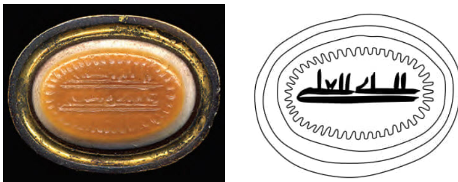
تصویر ۱۱: مهر موزه بریتانیا (Porter, 2011: Cat. 218) و ترسیم خط مهر شماره ۲

کلمه «الله» و کشیدگی کلمات و به‌ویژه حرف «ی» در هر دو مهر مشترک است. شباهت سبکی این دو مهر از نظر نوع نگارش، احتمال همزمانی آن‌ها را تقویت می‌کند. مهر شماره ۲ از نظر شیوه نگارش به سبک زاویه‌دار ساده، حروف باریک و کشیدگی حرف «ی» ویژگی‌های نوشتاری مهرهای سده دوم تا سوم هجری قمری را نشان می‌دهد (Ibid:15, 23). کشیدگی حروف و نمایش حرف «ع» به شکل «v» بر سکه‌های طاهری، صفاری، سامانی و غزنوی نیز دیده می‌شود (تصویر ۱۲).