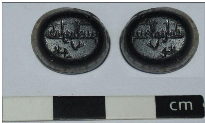
تصویر ۳: مهر هماتیت بیضی و سجع معکوس مهر