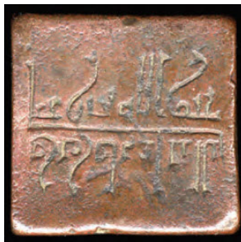
تصویر ۱۸: مهرهای موزه بریتانیا (Porter, 2011: Cat. 205) و ترسیم خط مهر شماره ۵