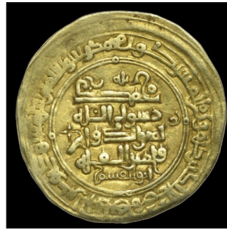
تصویر ۲۱: شیوه نگارش حرف «م» در کلمه ابوالقاسم در سکه‌های سلطان محمود غزنوی (رضائی باغبیدی، ۱۳۹۴: ۲۲۲؛ URL 2, 3)