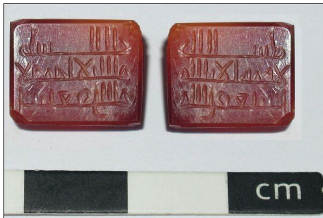
تصویر ۱: مهر عقیق چهارگوش و سجع معکوس مهر

این مهر با شماره بازیابی ۴۶۷۱، به ابعاد ۱ \times ۱ \times \frac{۱}{۳} سانتیمتر، به شکل مربع‌مستطیل با سطح تخت و گوشه‌های گرد شده است (تصویر ۱). اضلاع مهر با شیب کمی تراش خورده و گوشه بالای سمت راست مهر اندکی شکسته و کسردار است. در تراش حاشیه مهر دقت زیادی به کار نرفته است، به‌گونه‌ای که گوشه پایین سمت راست مهر تراش بیشتری خورده است. پشت مهر به شکل هرمی درآمده است. جنس مهر از عقیق به رنگ جگری شفاف است. در زمینه مهر، عبارتی در سه سطر به خط کوفی و حروف متصل به‌صورت درشت نوشته شده، به‌طوری‌که تمام زمینه مهر را اشغال کرده است. نوشته آن به این شرح است: «ماشالله لاقوه الا بالله استغفرالله».