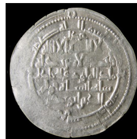
تصویر ۱۹: برگشت حروف در سکه‌های آل‌بویه (URL 1; heidemann, 2010: 166)