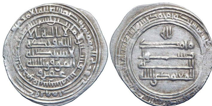
تصویر ۸: سکه عمرو بن لیث (URL 1)