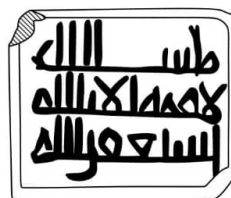
تصویر ۶: مهر موزه بریتانیا (Porter, 2011: Cat. 278) و ترسیم خط مهر شماره ۱