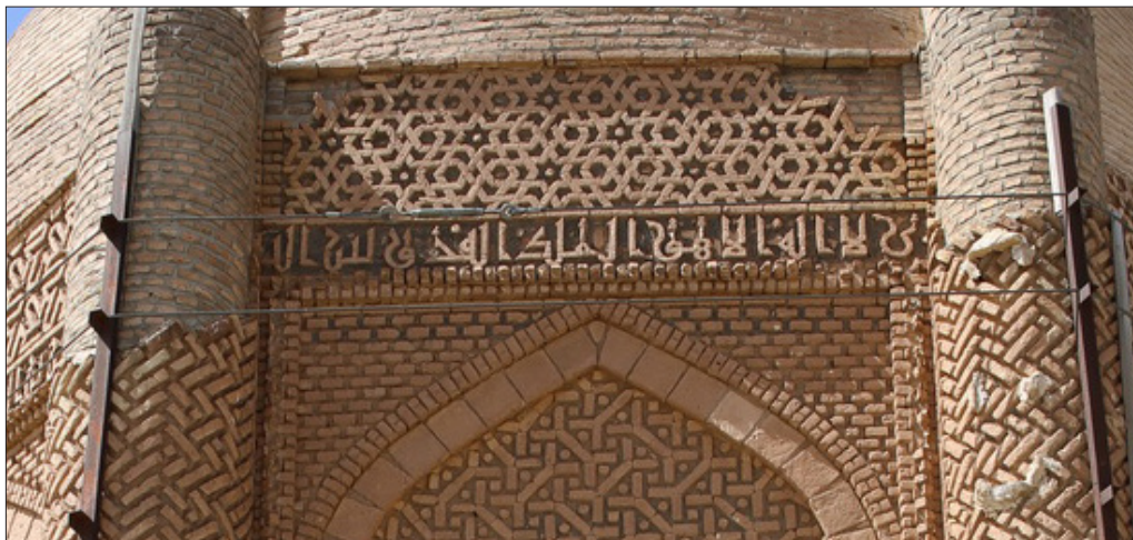
تصویر ۲۲: کتیبه برج شرقی خرقان (URL 4)