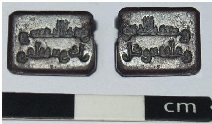
تصویر ۴: مهر چهارگوش و سجع معکوس مهر

این مهر با شماره بازیابی ۳۴۶۸، به ابعاد 1/3 \times 1 سانتیمتر به شکل چهارگوش و سطح تخت است که گوشه‌های آن پخ شده و دارای زوایای ملایمی است (تصویر ۴). اضلاع مهر با قوس اندکی به سطح صاف مهر منتهی می‌شود. به نظر می‌رسد این مهر بر نگین انگشتری نصب می‌شده که رکاب آن از بین رفته است. حاشیه سمت راست مهر شکسته و کسردار است. جنس مهر از سنگ هماتیت و به رنگ خاکستری شفاف است. پشت مهر نیز کاملاً تخت است. در زمینه مهر، عبارتی در دو سطر به خط کوفی نوشته شده است. خط آن درشت و پهن، کلمات نقر شده جدا از هم بوده و تناسب خط با زمینه مهر رعایت شده است. ابتدای حروف «الف» و «لام» به شکل مثلث شکاف‌دار درآمده است. نوشته سطر اول و دوم مهر به این شرح است: «و صفی بالله یثق و علیه یتوکل».