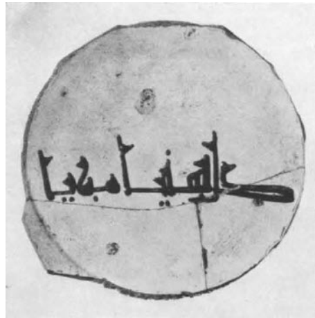
تصویر ۲۰: کاسه نیشابور، شیوه نگارش تزئین دو شاخه‌ای بر سر الف و لام و حرف آخر برگشته (Wilkinson, 1973: 121. Fig.46)