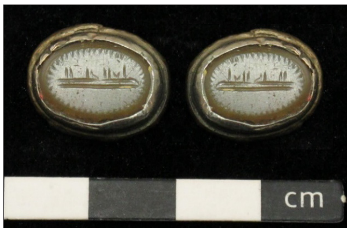
تصویر ۲: مهر عقیق بیضی و سجع معکوس مهر

این مهر با شماره بازیابی ۳۴۶۳، به ابعاد ۱ \times ۱/۵ سانتیمتر به شکل بیضی با سطح تخت است (تصویر ۲). حاشیه مهر با تراشی به صورت مایل درآمده و در داخل حلقه ساده دو پله‌ای نگین انگشتر جای گرفته است. جنس مهر از عقیق و به رنگ زیتونی شفاف است. حاشیه مهر با شیارهای عمودی به شکل مثلث تزئین شده است. در مرکز مهر عبارتی در یک سطر به خط کوفی به صورت باریک و کم‌عرض نقر شده است و حرف آخر کلمه دوم آن به صورت کشیده درآمده است. نوشته آن به این شرح است: «الله العلی».