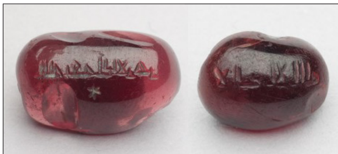
تصویر ۷: مهرهای موزه اشمولین (Kalus, 1986: LI902.8 / LI902.10)