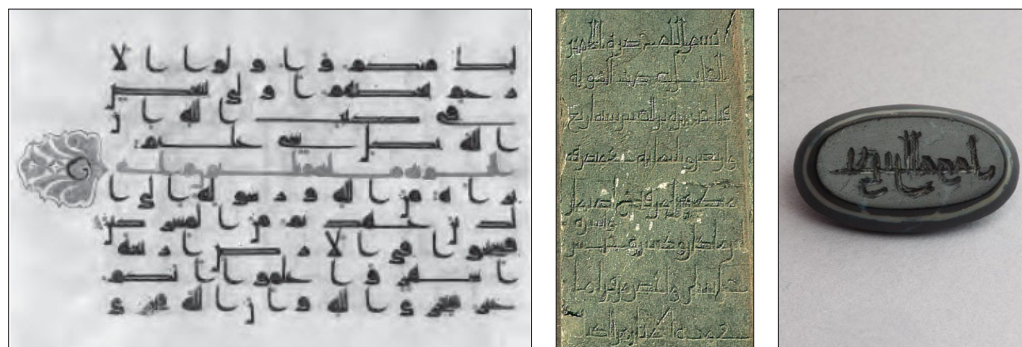
تصویر ۱۴: مهر موزه اشمولین (Kalus, 1986. L1902.11). تصویر ۱۵: نسخه‌ای از قرآن (علی بیگی و چارثی،

همچنین رسم‌الخط حرف «ن» در انتهای کلمه الحسن، حروف «الف» و «ق» با کتابت کوفی مصحف سده چهارم هجری قمری شباهت دارد (تصویر ۱۵). از سوی دیگر، نوشتار این مهر همسانی‌هایی در برخی از حروف مانند حروف شکاف‌دار با کتیبه نقر شده بر سنگ در تخت جمشید مربوط به سده چهارم هجری قمری دارد (تصویر ۱۶).