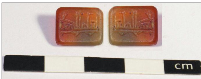
تصویر ۵: مهر عقیق چهارگوش و سجع معکوس مهر

این مهر با شماره بازیابی ۳۴۷۹، به ابعاد ۱/۲×۱ سانتیمتر به شکل مربع مستطیل و سطح تخت است که گوشه‌های آن گرد شده است (تصویر ۵). جنس آن از عقیق به رنگ نارنجی شفاف است. حاشیه مهر به صورت پهلوهایی مایل و پشت مهر با لبه پخ شده به شکل تخت درآمده است. در مرکز مهر عبارتی در یک سطر به خط کوفی به صورت درشت و پهن نقر شده است. سر حروف «الف»، «لام» و «میم» به صورت دو شاخه برگدار دیده می‌شود. انتهای حرف «م» به طرف بالا برگشته است. نوشته مرکز مهر به این شرح است: «نعم الولی علی».