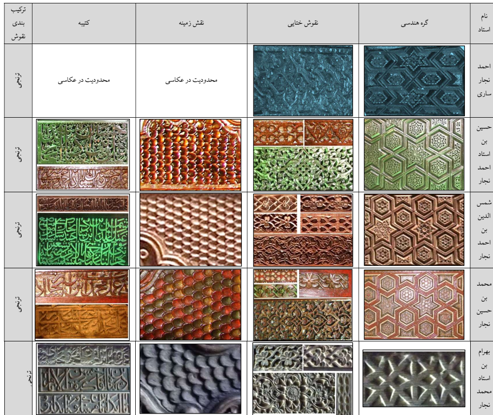
جدول ۳- نقوش و کتیبه در آثار چوبی خاندان احمد نجار (نگارندگان)

با توجه به جدول فوق می‌توان نتیجه گرفت که به رغم افتراق‌های جزئی، تشابهات فرمی زیادی در جمله‌گی آثار از قبیل: نقش گره هندسی شمسه شش و شش ضلعی، استفاده از نقوش گیاهی به‌خصوص ختایی‌ها با روش کنده‌کاری مشابه، همچنین نقوش گیاهی حاشیه قاب‌ها نیز در زمره این تشابه قرار می‌گیرد. از دیگر ویژگی‌های مشترک، استفاده از نوعی بافت فلس ماهی شکل در زمینه نقوش، ترکیب بندی ترنجی و همچنین به‌کارگیری قلم ثلث با مشق به‌نسبت خوب و باکیفیت در کتیبه‌ها، قابل اشاره است. بدین ترتیب، به‌نظر می‌رسد که استادان این خاندان نیز تجربیات کاری خود را -خودآگاه یا ناخودآگاه- به فرزندان‌شان منتقل کرده و یا دست کم تاثیر به‌سزایی بر روی یکدیگر نیز داشته‌اند.