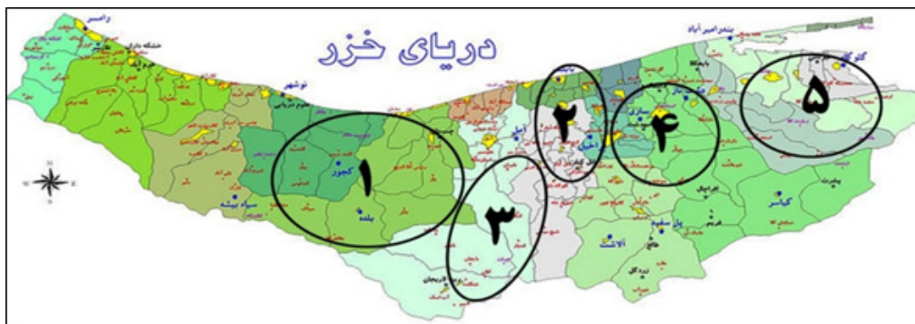
تصویر ۲- حوزه‌های تجمع آثار چوبی در بناهای آرامگاهی مازندران قرن ۹ و ۱۰ ه.ق شماره ۱: منطقه رستمدر، ۲: بابل و بابلسر، ۳: آمل و لاریجان، ۴: ساری، ۵: منطقه هزار جریب (نکا، بهشهر، گلوگاه) (ماخذ: نگارندگان)